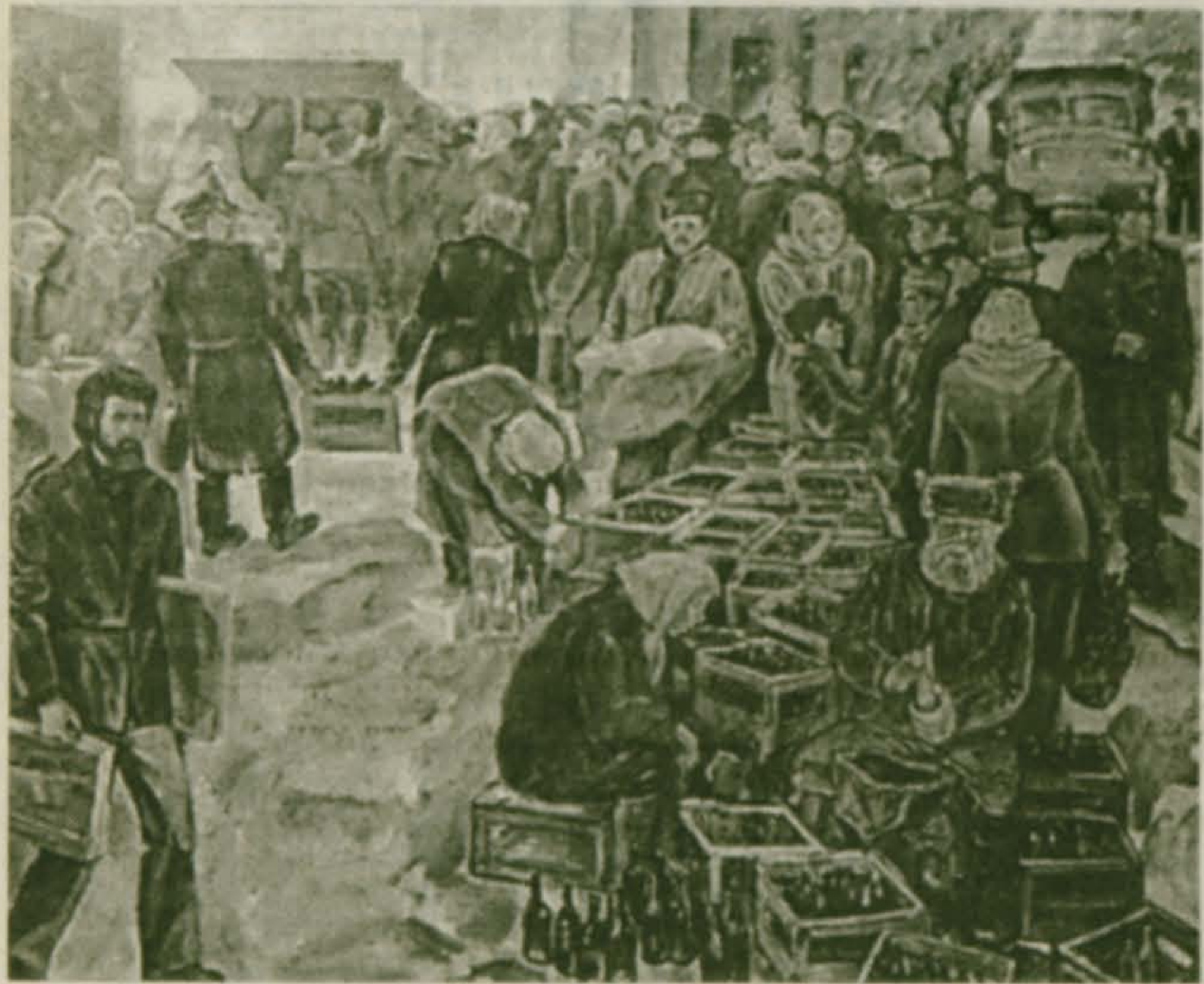
Люберцы. Послевоенный рынок

чальника отдела собрались все причастные к делу сотрудники для окончательного решения. И тут из военного госпиталя позвонил оперативник-смершевец, доложивший, что «беглец» найден.