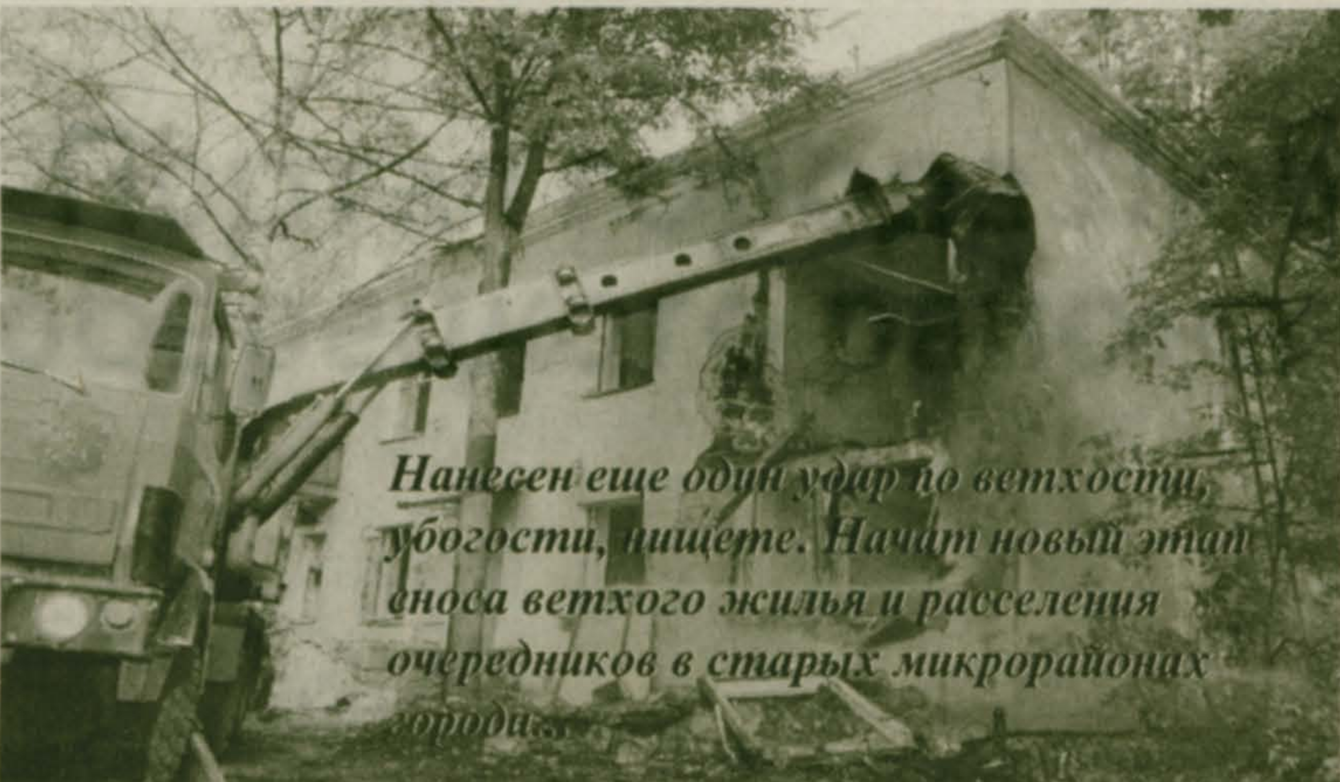
Нанесен еще один удар по ветхости, убогости, нищете. Начат новый этап сноса ветхого жилья и расселения очередников в старых микрорайонах города...

нию новых домов. Многие наши земляки смогли улучшить свои жилищные условия. К примеру, жильцы этих двух домов - №№ 49 и 50 - окончательно расстались с былой жизнью в двухэтажных бараках несколько месяцев назад. Именно тогда люди в последний раз вышли за порог своих крохотных квартир, построенных для них когда-то заводом им. Ухтомского. Сегодня здесь большая стройплощадка, территория вокруг огорожена. В декабре 2004 года на этом месте будет возведен 12-этажный трехподъездный красавец-дом (моноклит, в ярко-оранжевой