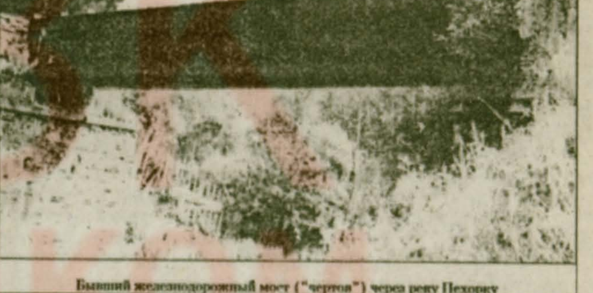
Бывший железнодорожный мост ("чертов") через речку Пехорку

Что же касается постройки часовни в Хлыстово, то это не просто "Куприянов". Часовня Рождества Христова была построена в самом начале XX века. Она стала главной святыней местных верующих, и по сию пору о Хлыстовской часовне ходят легенды.