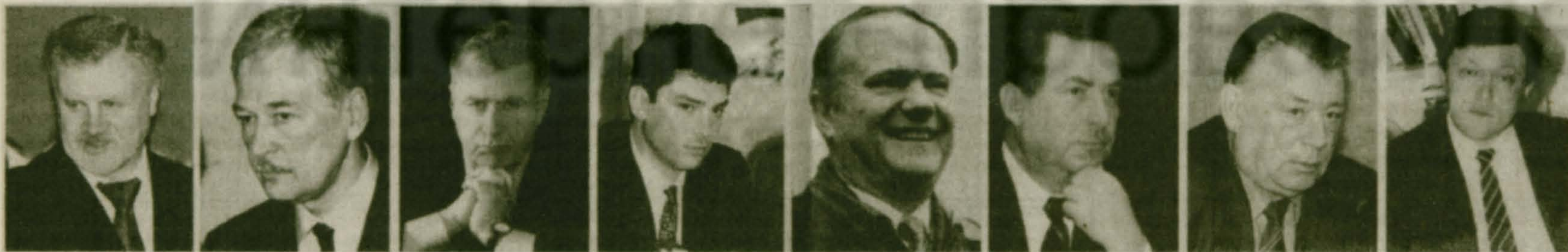
С.М. Миронов Б.В. Грызлов В.В. Жириновский Б.Е. Немцов Г.А. Зюганов Г.Н. Селезнев Г.И. Райков Г.А. Явлинский

концентраты)", которым будет определен порядок применения торговых надбавок к ценам на продукты детского питания.