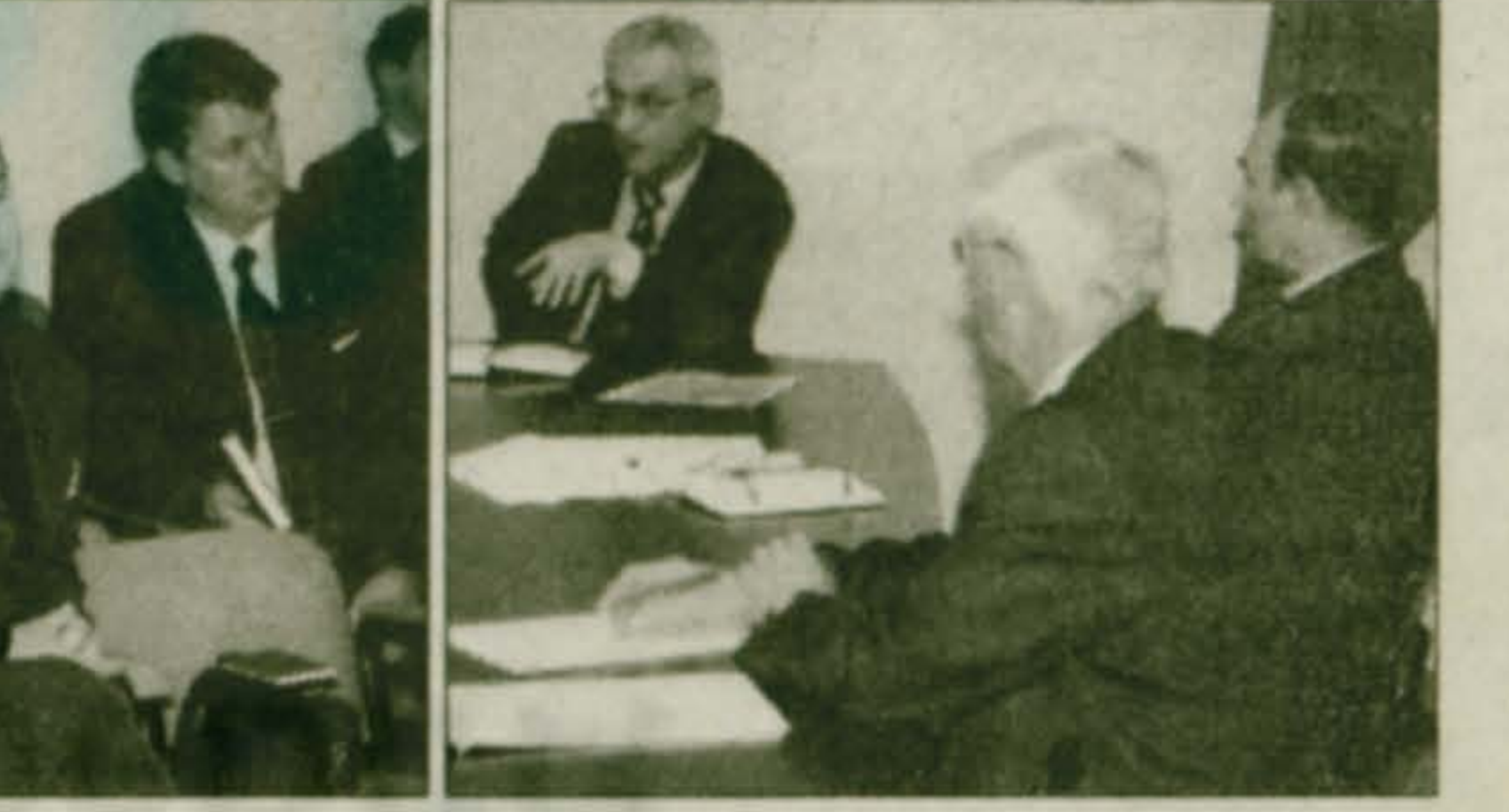
проводить на территории района санитарно-эпидемиологические мероприятия для обеспечения жителей благоприятных условий проживания. На ВЗУ, где не соблюдаются санитарные нормы, пройдут проверки с участием прокуратуры.