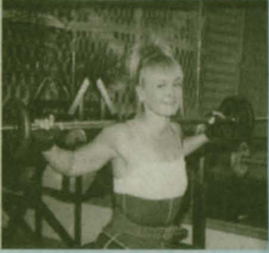
«Созидание» стало маленьким оазисом.

Насколько женщинам необходимо занятия шейпингом или йогой, а мужчинам – тренажерный зал, показывает посещаемость. Жизнь