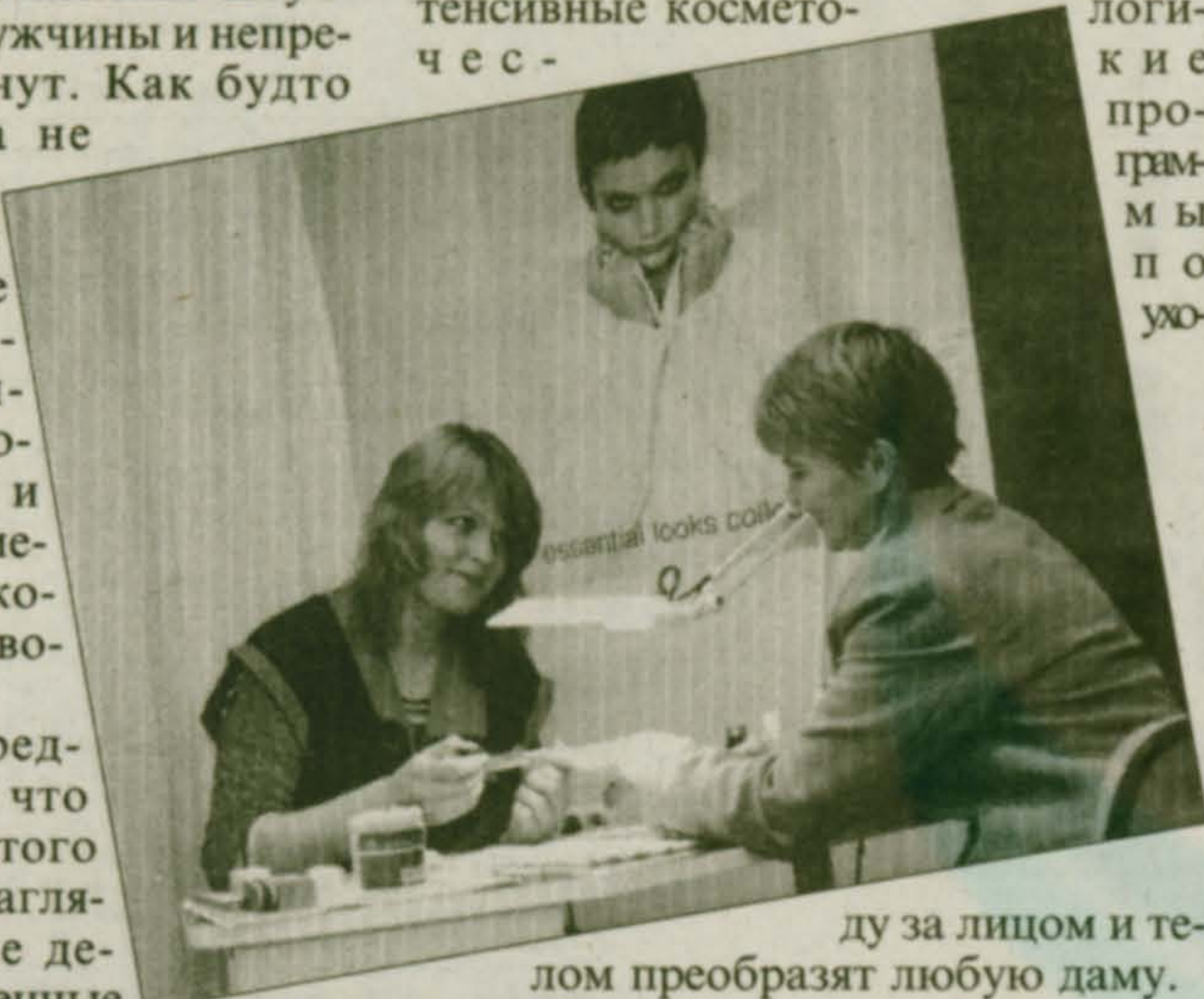
Уход за лицом и телом преобразят любую даму. Люберчанам

налов, к примеру, салона “Созидание”. Правильно проведенные интесивные косметические