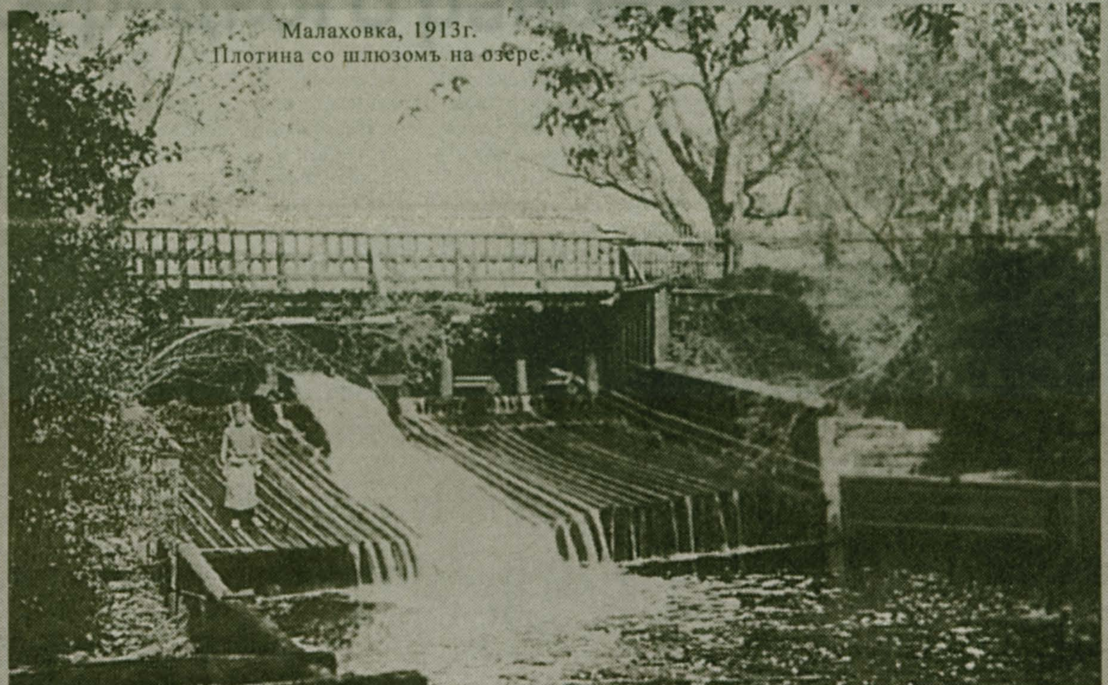
Малаховка, 1913 г. Плотина со шлюзом на озере.

Материал о мельнице при озере - читайте на стр. 2.