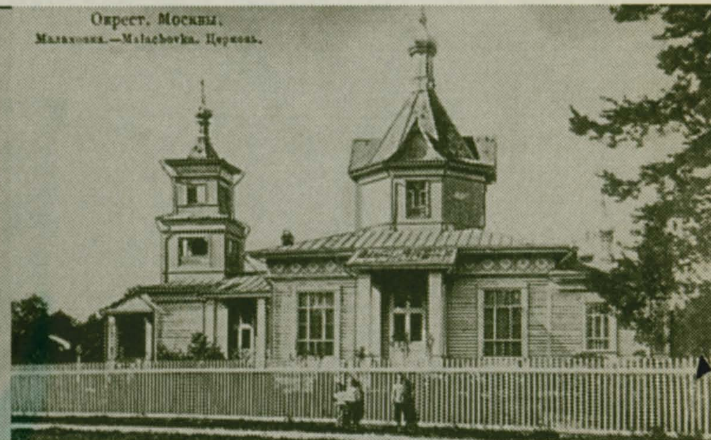
Окрест. Москвы. Малаховка - Malachovka. Церковь.

В этом году 12 июля, как раз в день славных и всехвалёных первоверховных апостолов Петра и Павла нашему малаховскому Храму, названному в честь сих святых, исполняется ровно 100 лет. Дай Бог!