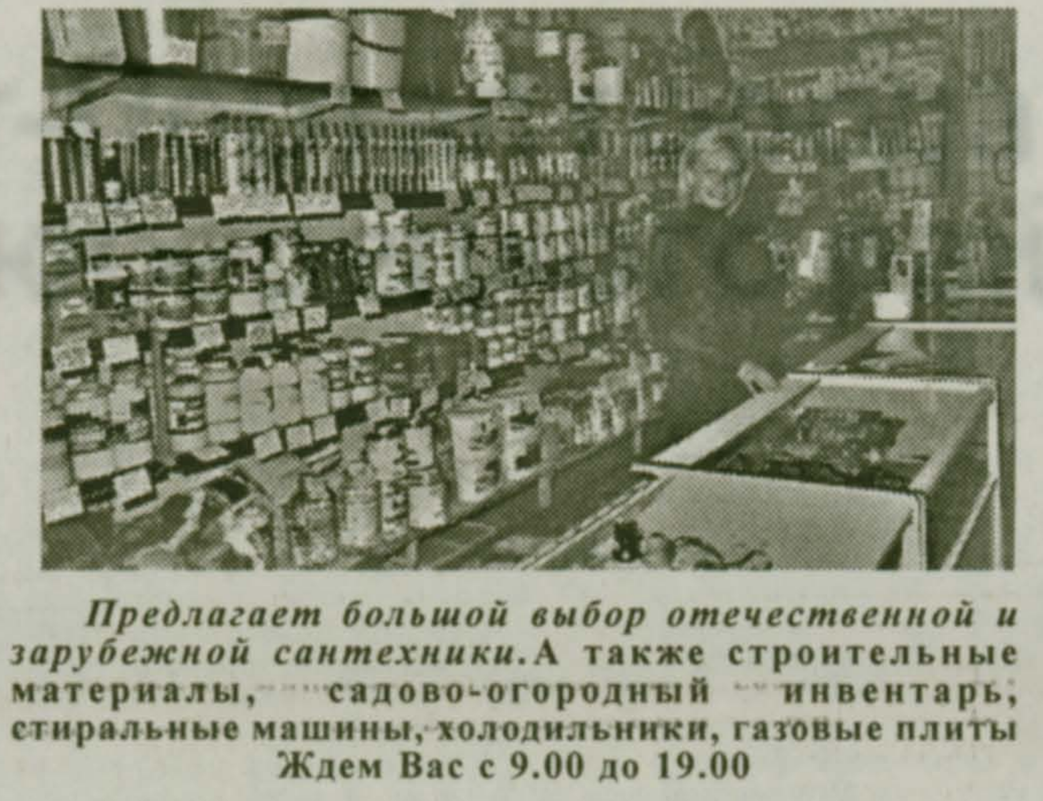
Предлагает большой выбор отечественной и зарубежной сантехники. А также строительные материалы, садово-огородный инвентарь, стиральные машины, холодильники, газовые плиты. Ждем Вас с 9.00 до 19.00

ООО «Логика» приглашает покупателей в Магазин «ТОВАРЫ БЫТА» Малаховка, Большое Кореневское шоссе, д. 1 т/факс 501-10-72, склад 501-50-09