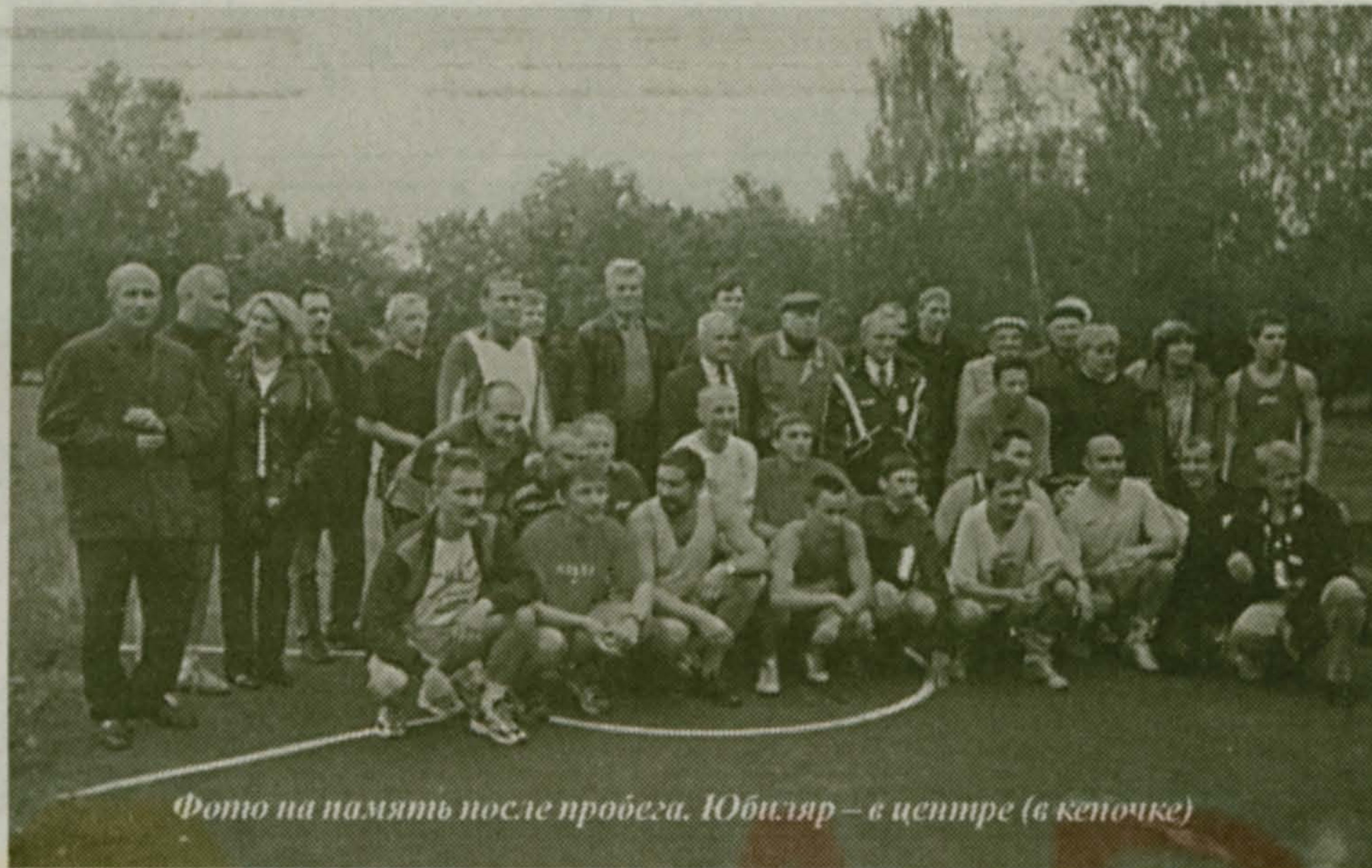
Фото на память после пробега. Юбиляр – в центре (в кепочке)