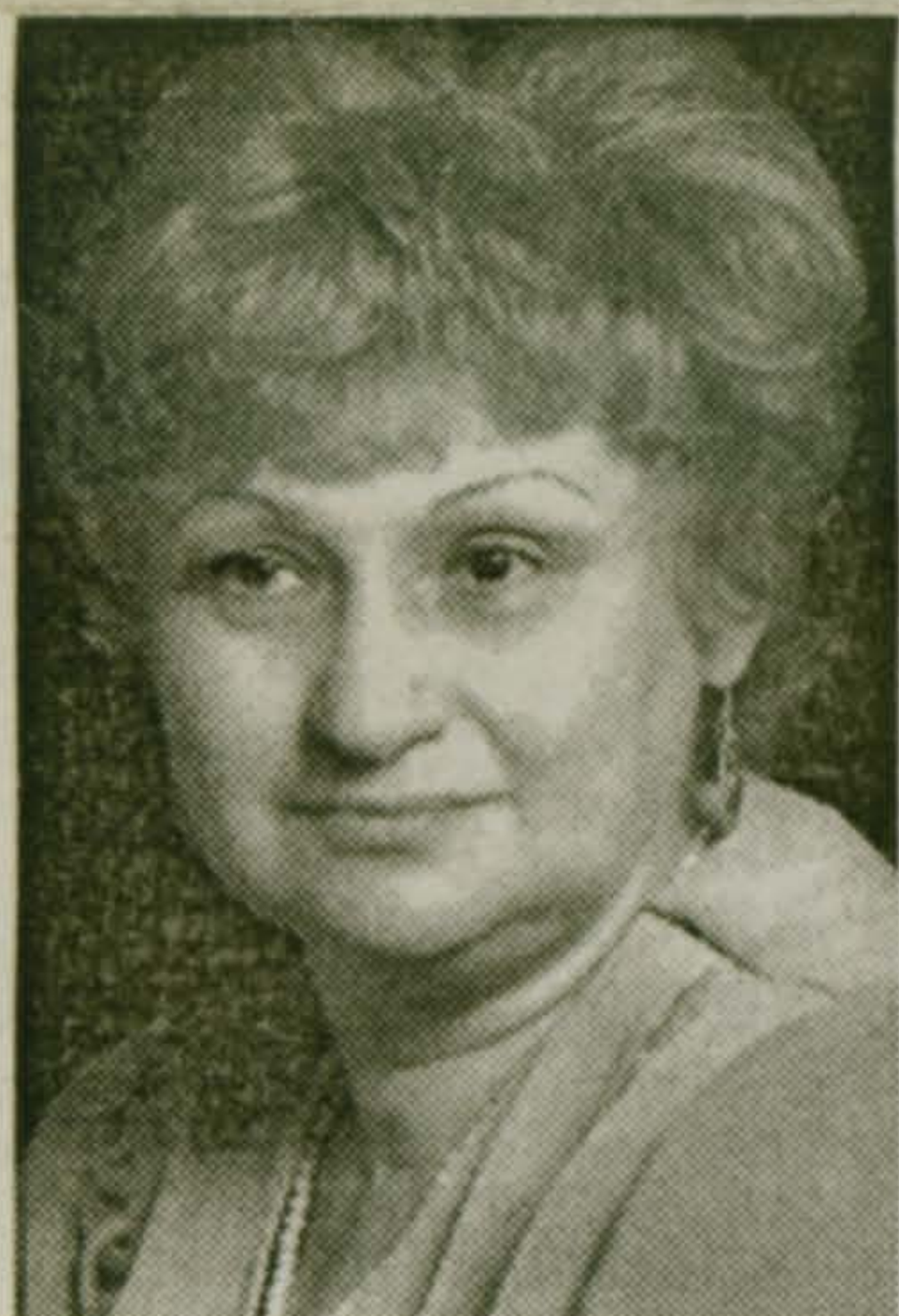
Дорогая Анна Давыдовна!

- Речь идет о единовременной, одноразовой премии? - Нет, это ежемесячная доплата в течение года. А кроме того, принимая на службу в школу молодых специалистов глава делает им как бы подарок: на День учителя – по тысяче рублей. Еще награжденные Грамотой главы поселка тоже получают к ней по 300 рублей. Это не только учителям, но каждому награжденному – с этого года... Беседавал В.Антонов (Продолжение следует)