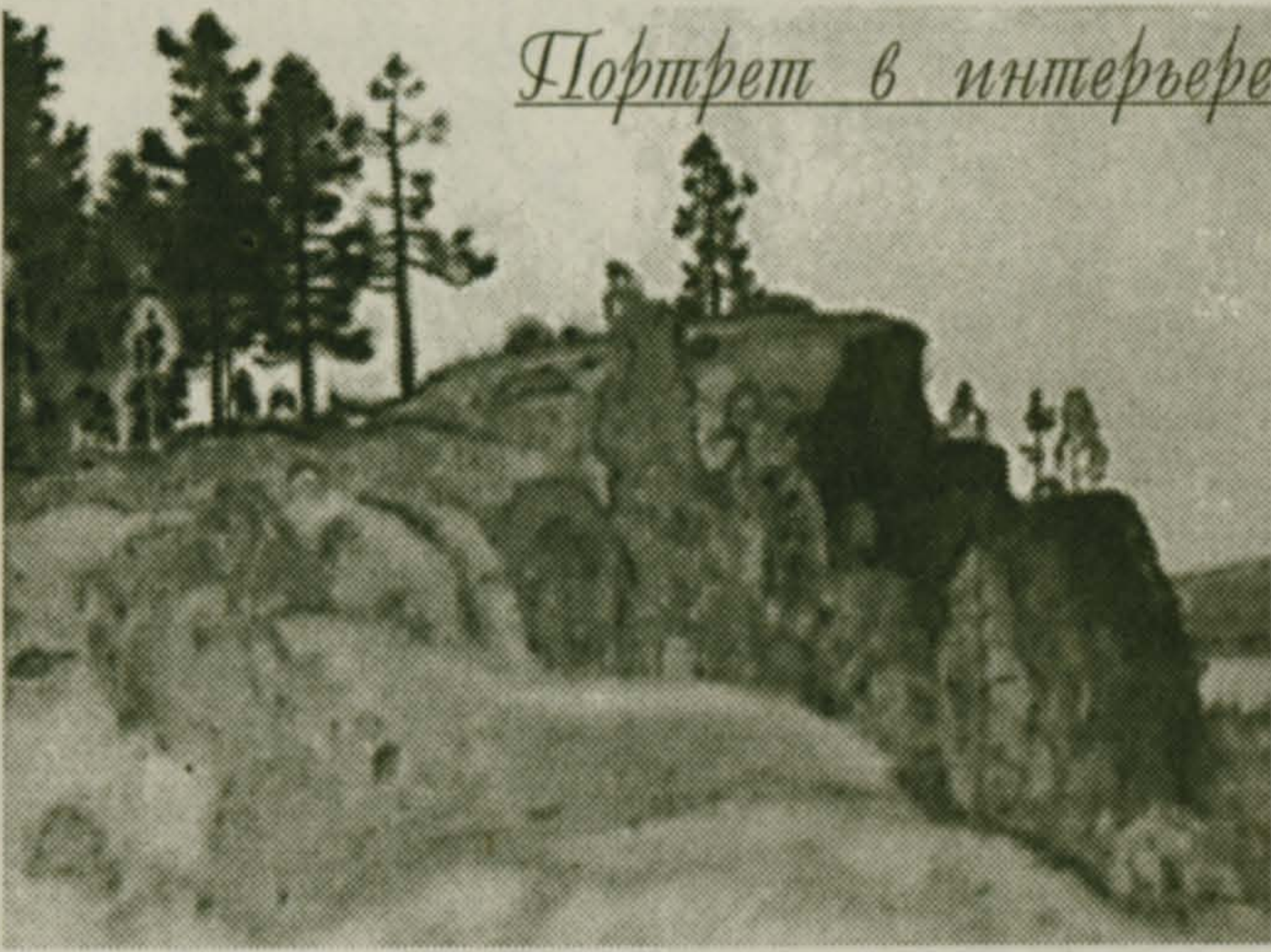
Портрет в интерьере