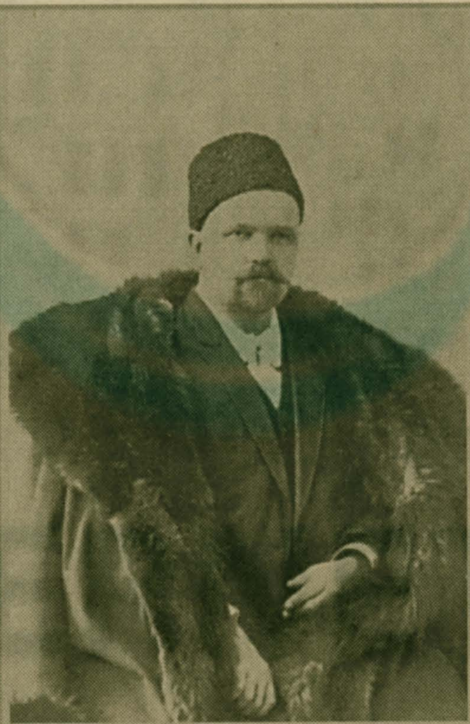
Владимир Алексеевич Гиляровский. Москва. 1880-е гг.

Он любил писать стихи. Известны его поэмы «Петербург» и «Стенька Разин». У Телешова