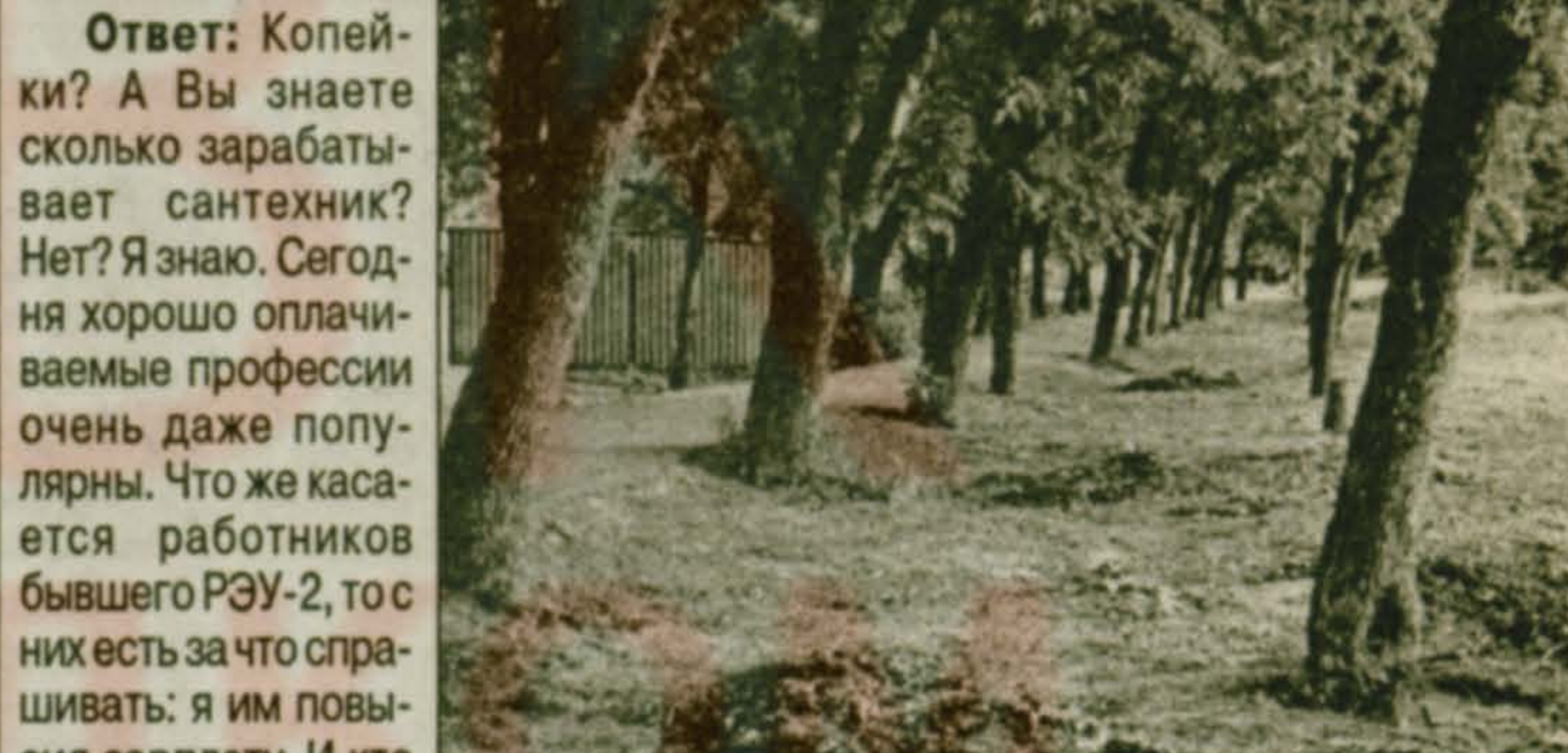
Началось благоустройство микрорайона: новые очертания старой аллеи у пруда в Поселке птицефабрика.