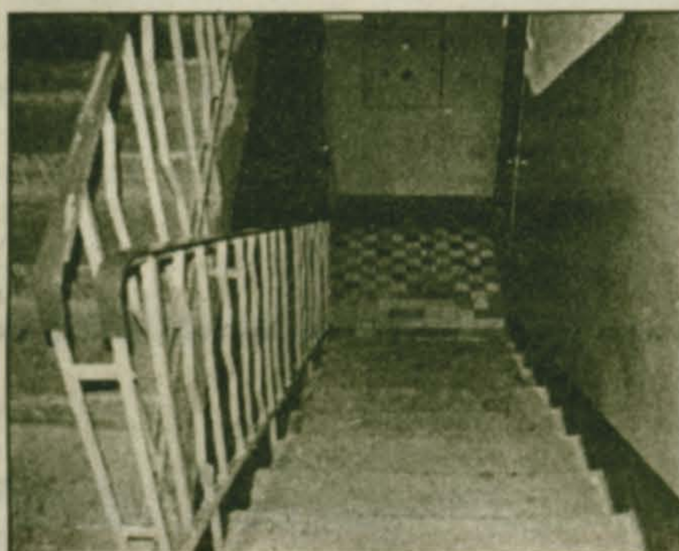
Отремонтированные подъезды на «Птичке»

Началось благоустройство микрорайона: новые очертания старой аллеи у пруда в Поселке птицефабрика.