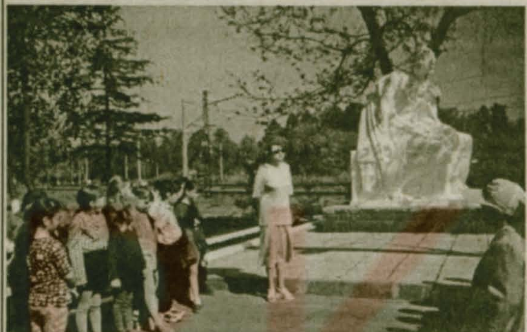
В день рождения А.С.Пушкина гимназисты возлагают цветы к памятнику поэта

В томиллинской гимназии № 18 работал летний лагерь дневного пребывания. По сравнению с прошлым годом количество детей, которые предпочли часть летних каникул провести в поселке, значительно увеличилось. И это неудивительно, живем мы в одном из живописных, традиционно дачных мест Подмосковья. Условия пребывания детей в летнем лагере из года в год улучшаются. Преподаватели говорят, что желающих попасть сюда очень много. Ребятам здесь не приходится