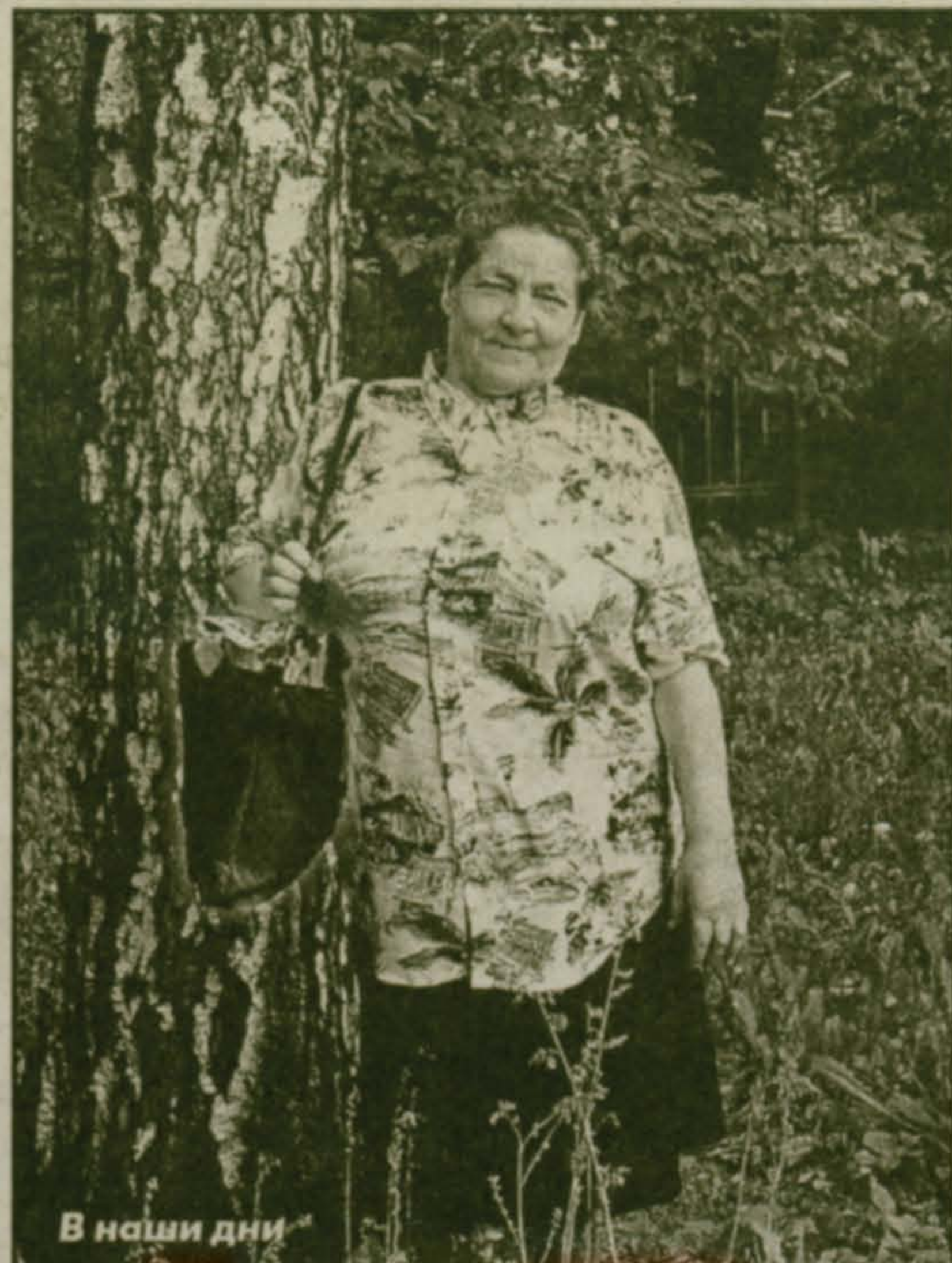
В наши дни