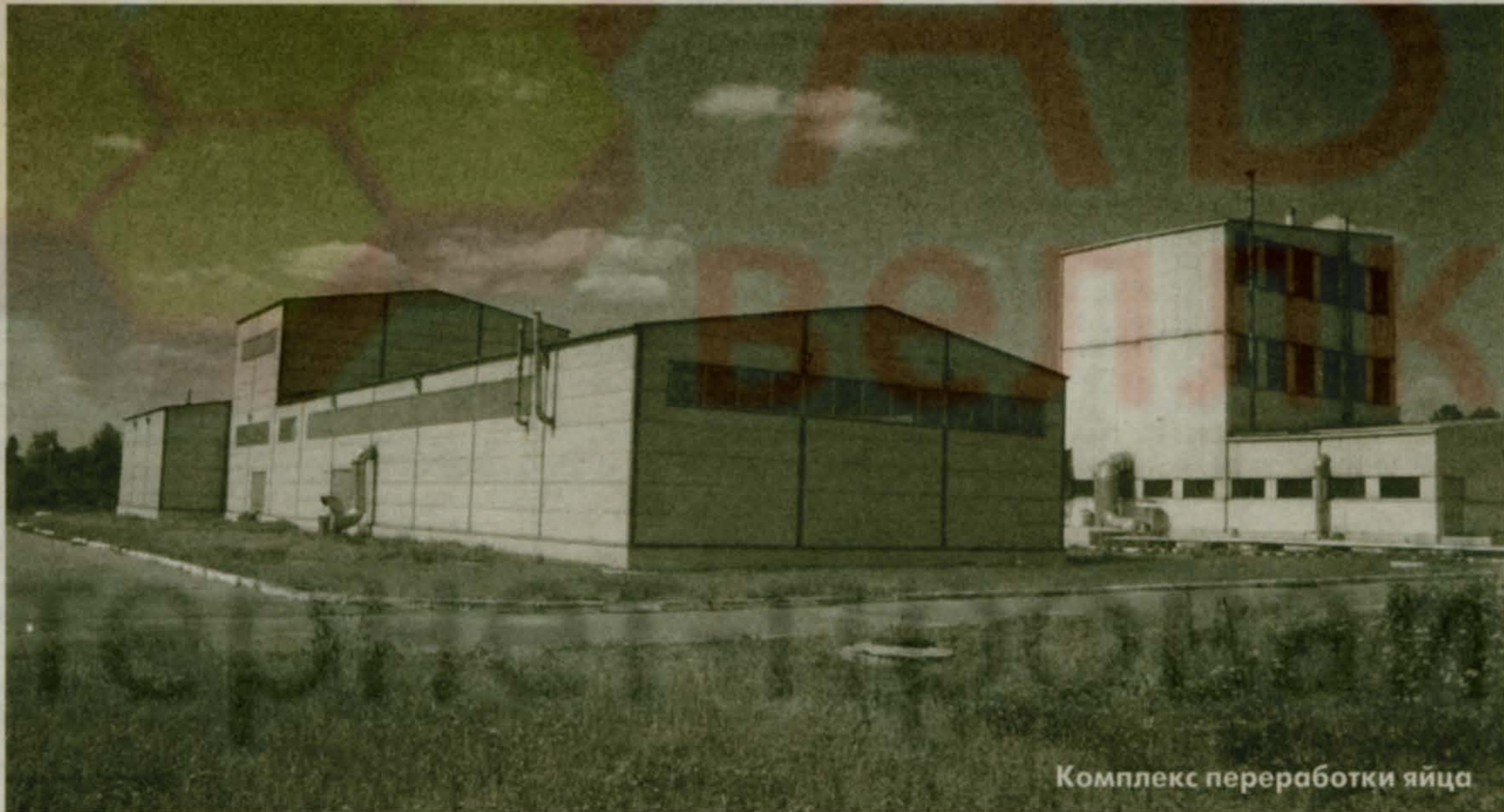
Комплекс переработки яйца