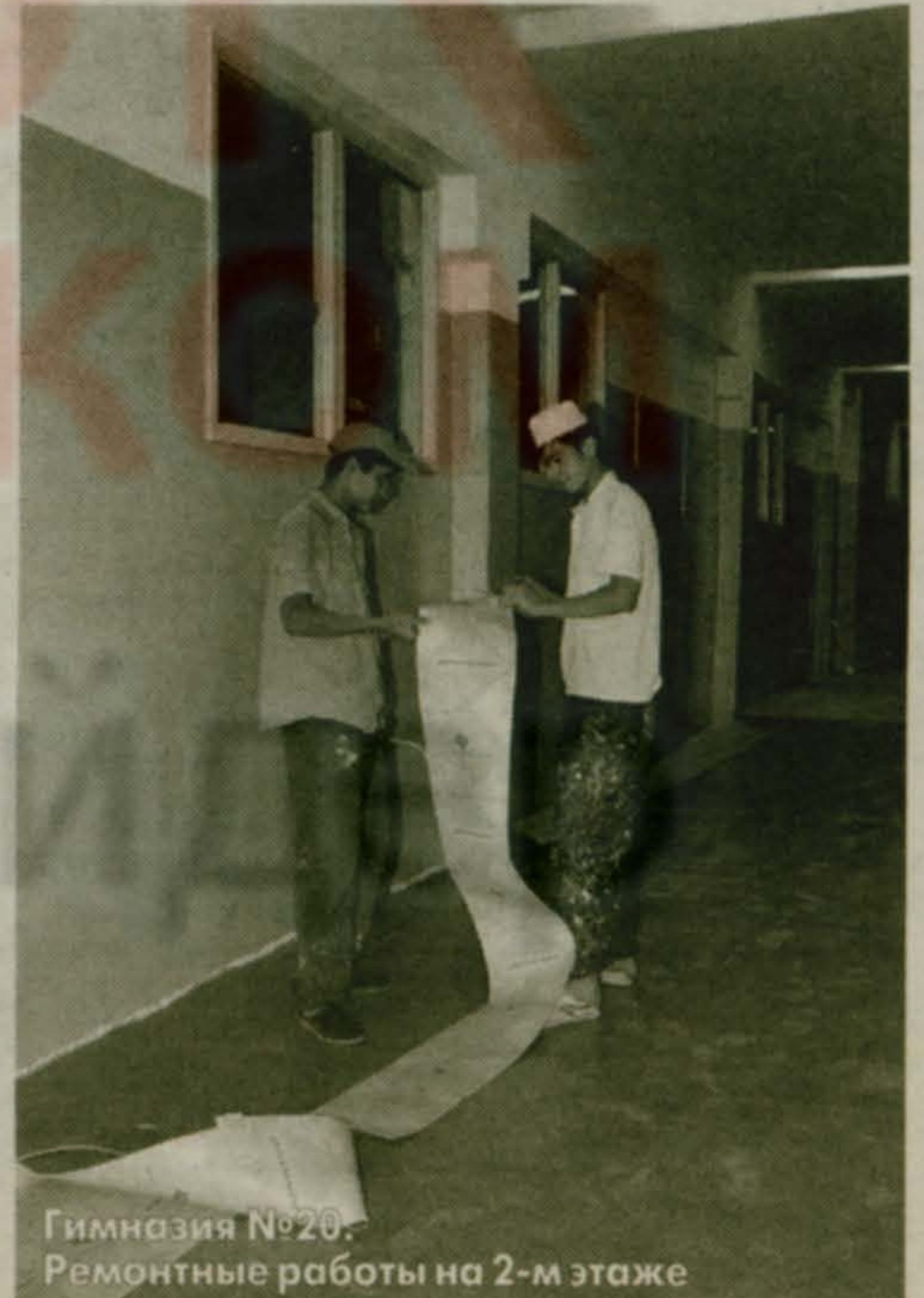
Гимназия №20. Ремонтные работы на 2-м этаже