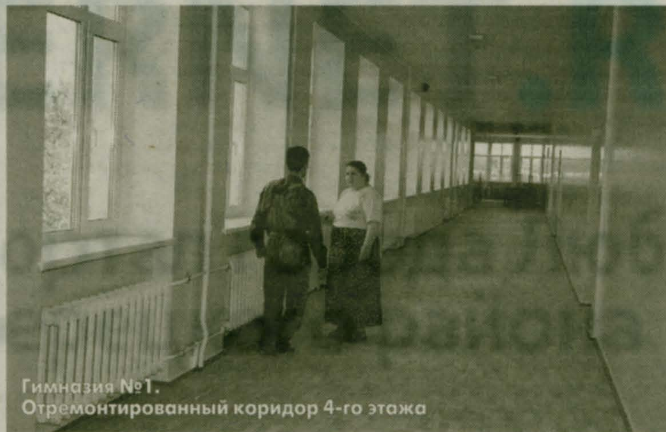
Гимназия №1. Отремонтированный коридор 4-го этажа

Заканчиваются работы по подготовке и опрессовке внутренних тепловых систем к предстоящему осенне-зимнему сезону. Таким образом, из 66 учреждений, находящихся на балансе комитета по образованию, по состоянию на 15 августа определенные результаты есть лишь в 49, что составляет 74%. В поселках Томилино, Малаховка, Октябрьский подготовка отопительных систем уже завершается. Данная работа в учреждениях пос. Красково проходит неудовлетворительно.