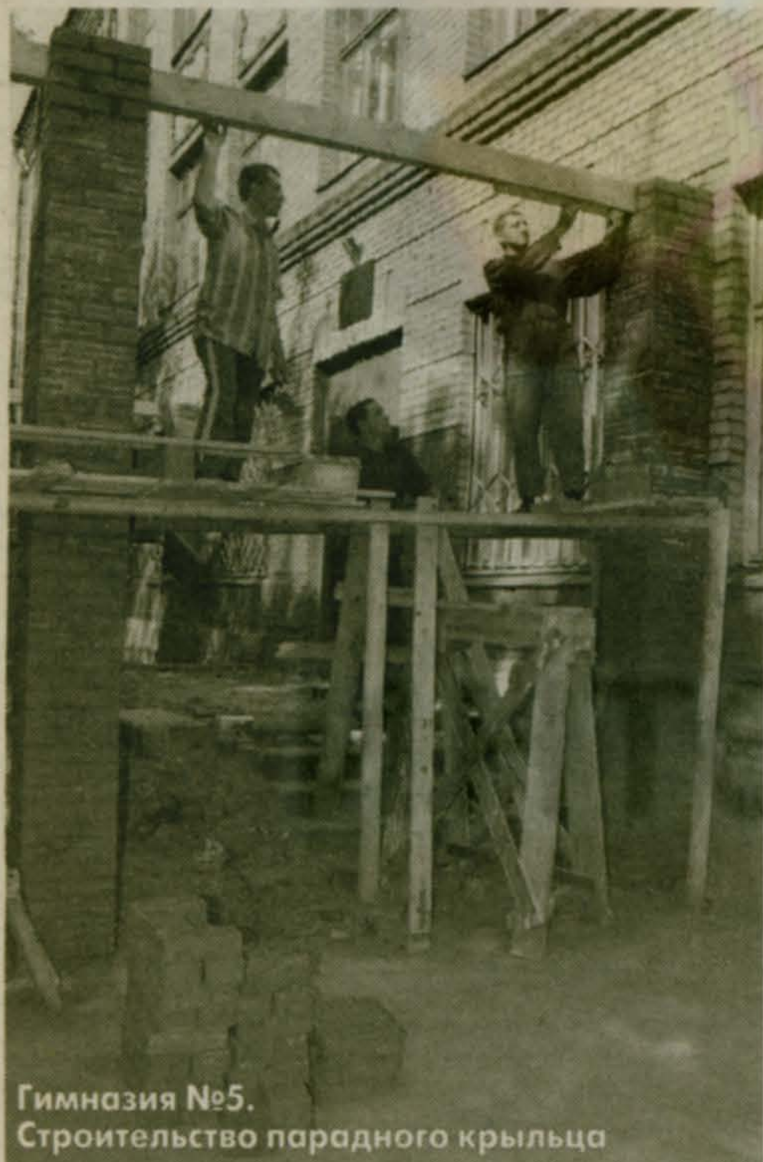
Гимназия №5. Строительство парадного крыльца