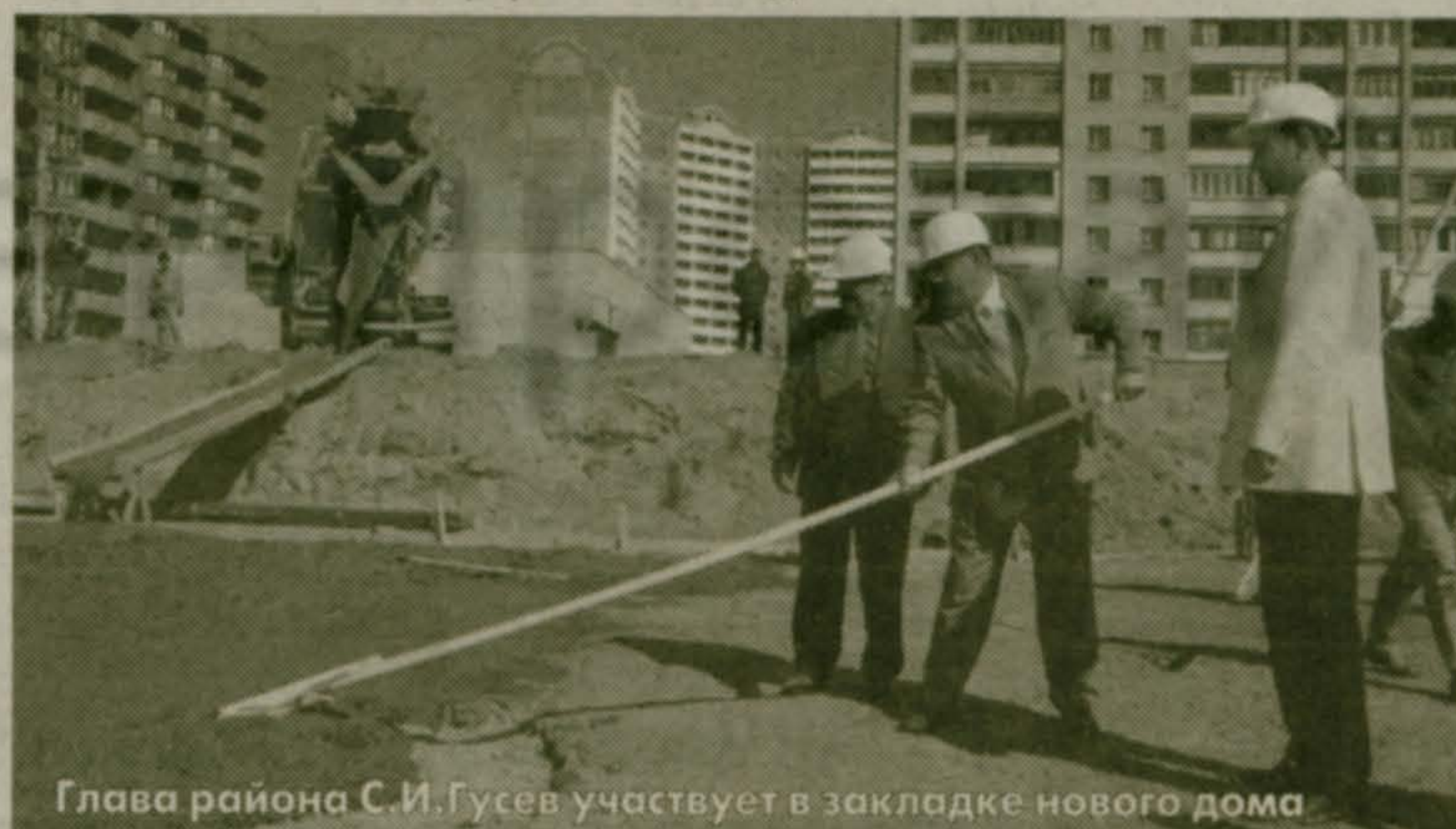
Глава района С.И.Гусев участвует в закладке нового дома

Практика показала, что так удобнее для всех - и для строителей, они быстрее сдают дом, и для жильцов, которые займутся отделкой каждый по своему усмотрению и, конечно же, исходя из своих финансовых возможностей.