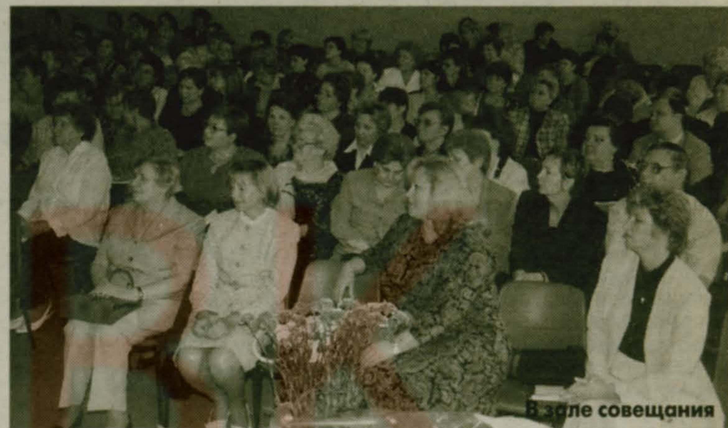
В зале совещания