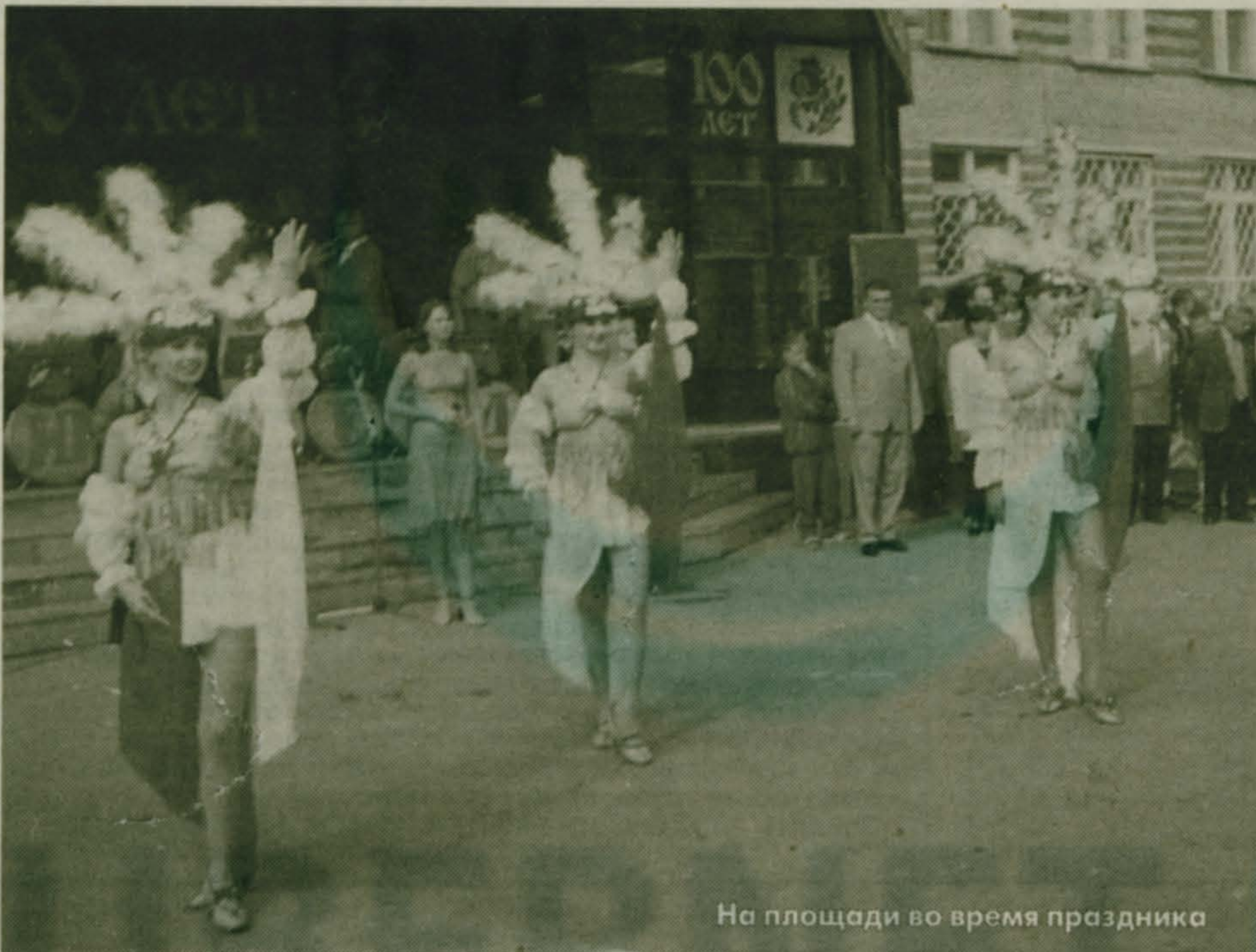
На площади во время праздника

Сегодня путь сюда недолог. От метро "Выхино" комфортабельный автобус за час довезет вас до этих мест. Здесь красиво и весной, когда цветут яблоневые сады, и осенью, когда вдоль шоссе у крестьянских домов выставлены на продажу овощи и фрукты, свежие молочные продукты - все, что дает гжельская земля. За речкой Гжелкой возвышается цех майолики с фирменным магазином, а далее на каждом километре - лотки с фарфором, магазины, киоски и мага-