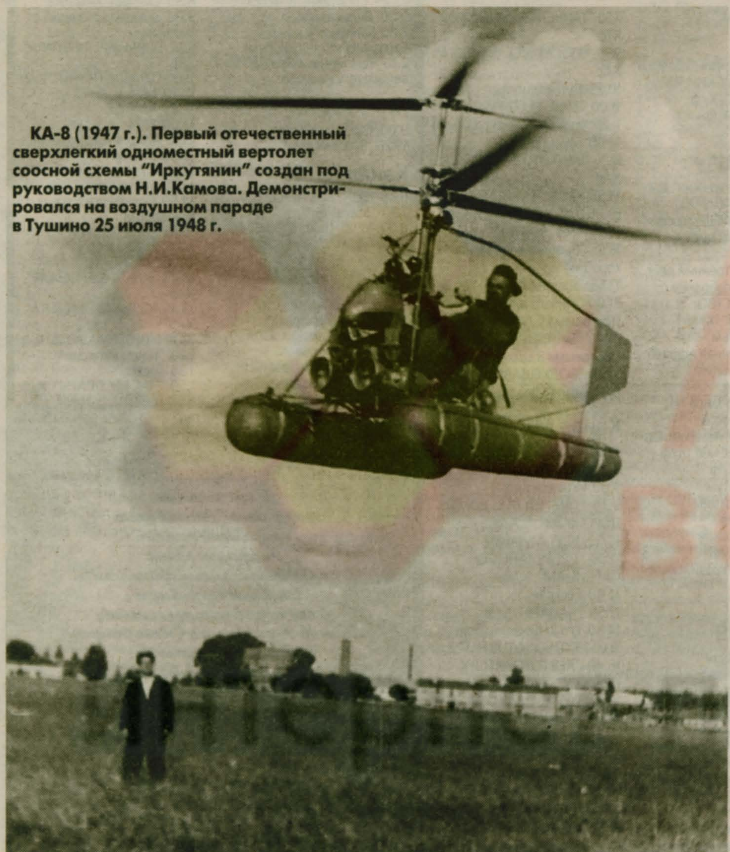
КА-8 (1947 г.). Первый отечественный сверхлегкий одноместный вертолет соосной схемы “Иркутянин” создан под руководством Н.И. Камова. Демонстрировался на воздушном параде в Тушино 25 июля 1948 г.