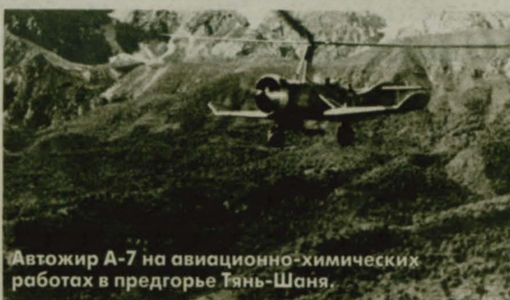
Автожир А-7 на авиационно-химических работах в предгорье Тянь-Шаня.

Это подтверждается подлинными документами Центрального архива Министерства обороны