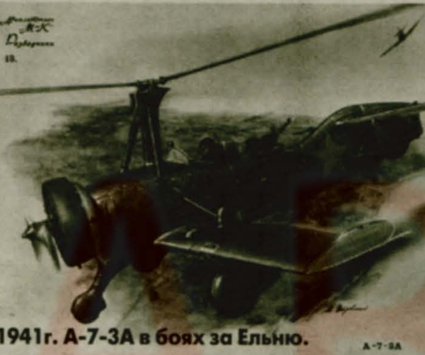
1941 г. А-7-ЗА в боях за Ельню.

27-28 сентября в эскадрилье побывали Камов и группа сотрудников завода № 290. Камов съездил и на КП артиллерийского полка, где интересовался мнением артиллеристов об автожирах. По воспоминаниям Миля, отзывы были очень хорошие. На следующий день прилетела пара отремонтированных А-7-ЗА с завода. Но обстановка на фронте стремительно ухудшилась. Противник усилил давление на наши войска, перебросив на ельнинское направление дополнительные силы. Начался отход, снялся с места истребительный полк. На аэродроме остались всего три автожира. Связь между командованием армии и штабом фронта была прервана, немцы впервые использовали мощные передатчики помех, заглушив работу связанных радиостанций. Важнейшее сообщение о прорыве стыка между 24-й и 43-й армиями было поручено доставить в штаб фрон-