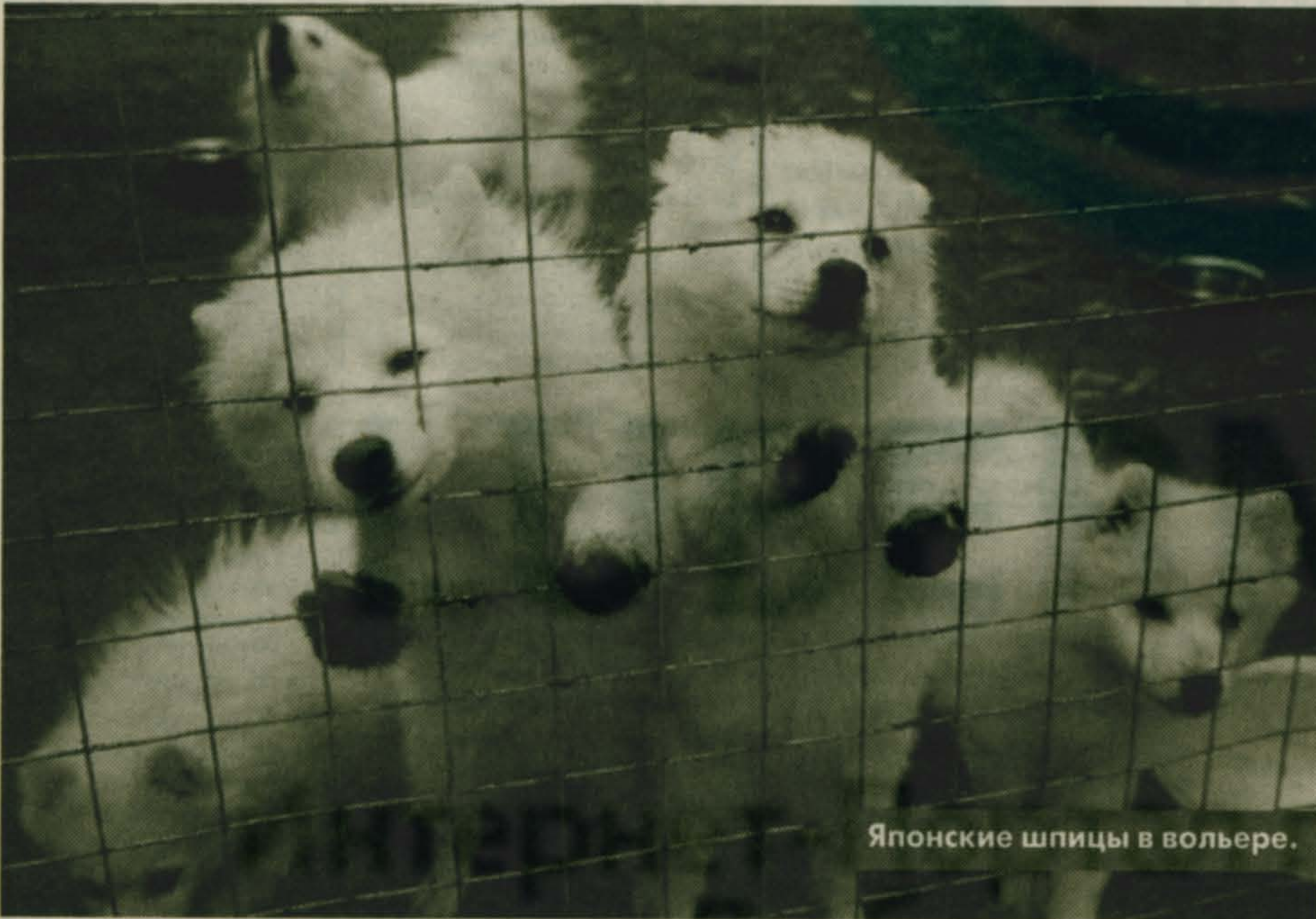
Японские шпицы в вольере.

В НАЧАЛЕ ЭТОГО ГОДА В МАЛАХОВКЕ ОТКРЫЛСЯ ПИТОМНИК ПО ДРЕССИРОВКЕ СОБАК. В НЕМ РАБОТАЮТ БЫВШИЕ СОТРУДНИКИ АНТИТЕРРОРИСТИЧЕСКОЙ ОРГАНИЗАЦИИ “АЛЬФА”. НЕДАВНО ТАМ ПОБЫВАЛИ ЖУРНАЛИСТ И ФОТОГРАФ НАШЕЙ ГАЗЕТЫ.