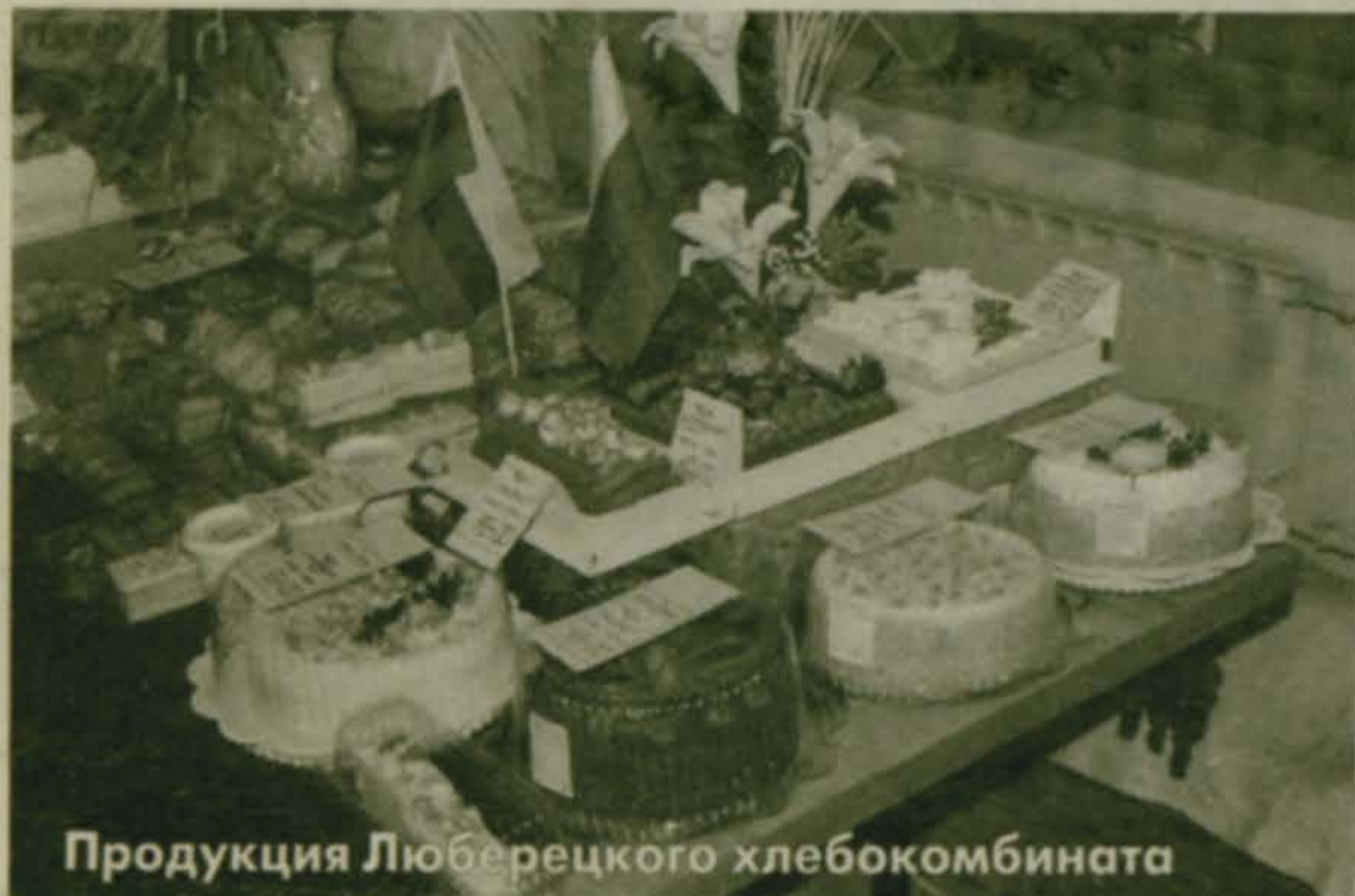
Продукция Люберецкого хлебокомбината

1 НОЯБРЯ В РАЙОННОЙ АДМИНИСТРАЦИИ СОСТОЯЛОСЬ ЗОНАЛЬНОЕ СОВЕЩАНИЕ ЗАМЕСТИТЕЛЕЙ ГЛАВ 14 МУНИЦИПАЛЬНЫХ ОБРАЗОВАНИЙ ПОДМОСКОВЬЯ С УЧАСТИЕМ РАБОТНИКОВ ТОРГОВЛИ МОСКОВСКОЙ ОБЛАСТИ. ЭТО КРУПНОЕ И ЗНАЧИМОЕ МЕРОПРИЯТИЕ ПРЕДВОСХИТИЛА ВЫСТАВКА-ЯРМАРКА МЕСТНЫХ ТОВАРОПРОИЗВОДИТЕЛЕЙ. ВЫСТАВКА, ОРГАНИЗОВАННАЯ РАЙОННОЙ АДМИНИСТРАЦИЕЙ, РАСПОЛОЖИЛАСЬ В ФОЙЕ ПЕРВОГО ЭТАЖА. РАЙОННЫЕ ПРЕДПРИЯТИЯ ПОСТАРАЛИСЬ НА СЛАВУ: КРАСОЧНО ОФОРМИЛИ СВОИ СТЕНДЫ, БУКВАЛЬНО ЗАСТАВИЛИ СТОЛЫ СВОЕЙ ЛУЧШЕЙ ПРОДУКЦИЕЙ - В ОБЩЕМ, ПРИГОТОВИЛИСЬ К СОТРУДНИЧЕСТВУ С ДРУГИМИ МУНИЦИПАЛЬНЫМИ ОБРАЗОВАНИЯМИ ПОДМОСКОВЬЯ. ВЕДЬ, ЗАИНТЕРЕСОВАВ "СОСЕДЕЙ" СВОЕЙ ПРОДУКЦИЕЙ, ЛЮБЕРЕЦКИЕ ФИРМЫ И КОМБИНАТЫ МОГУТ НАЧИНАТЬ ДЕЛОВЫЕ ОТНОШЕНИЯ С ВЫХОДОМ НА ОБЛАСТНОЙ И ФЕДЕРАЛЬНЫЙ УРОВНИ.