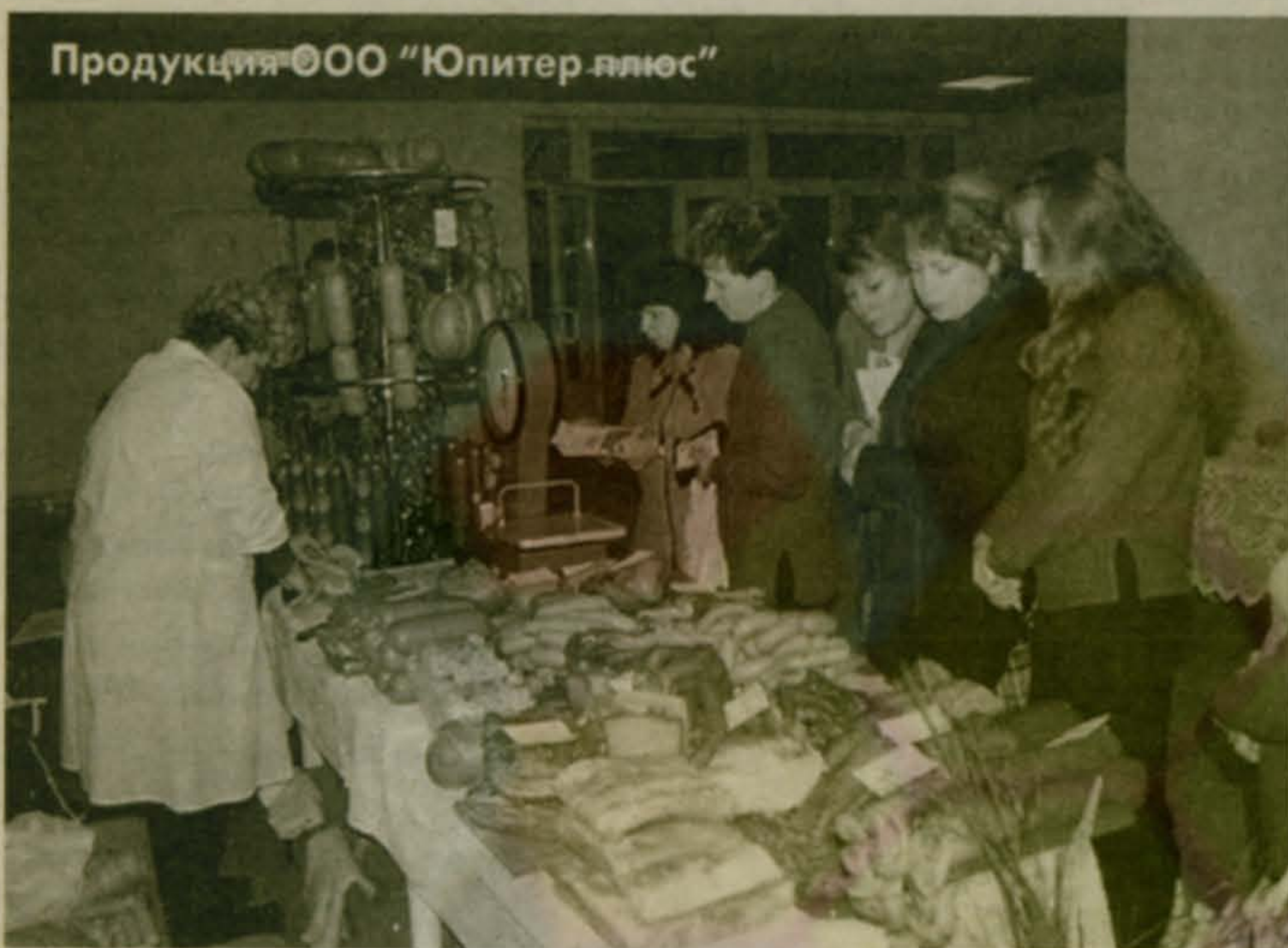
Продукция ООО "Юпитер плюс"