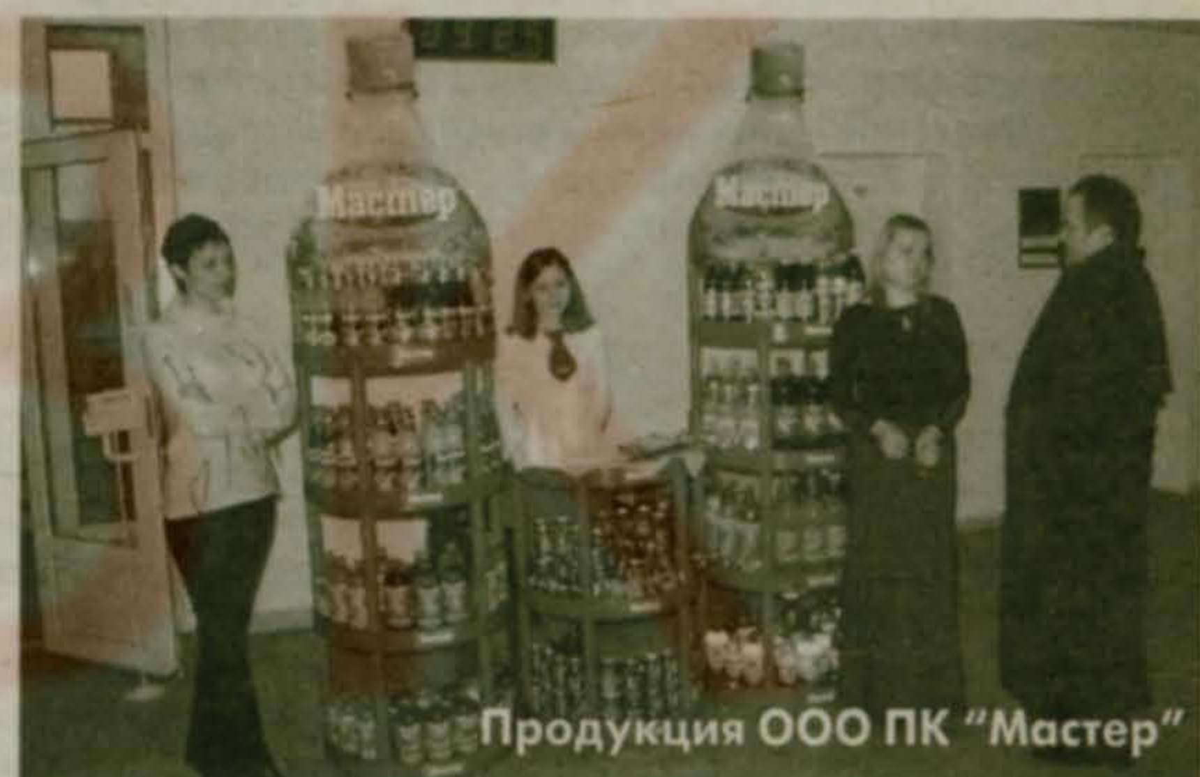
Продукция ООО ПК "Мастер"