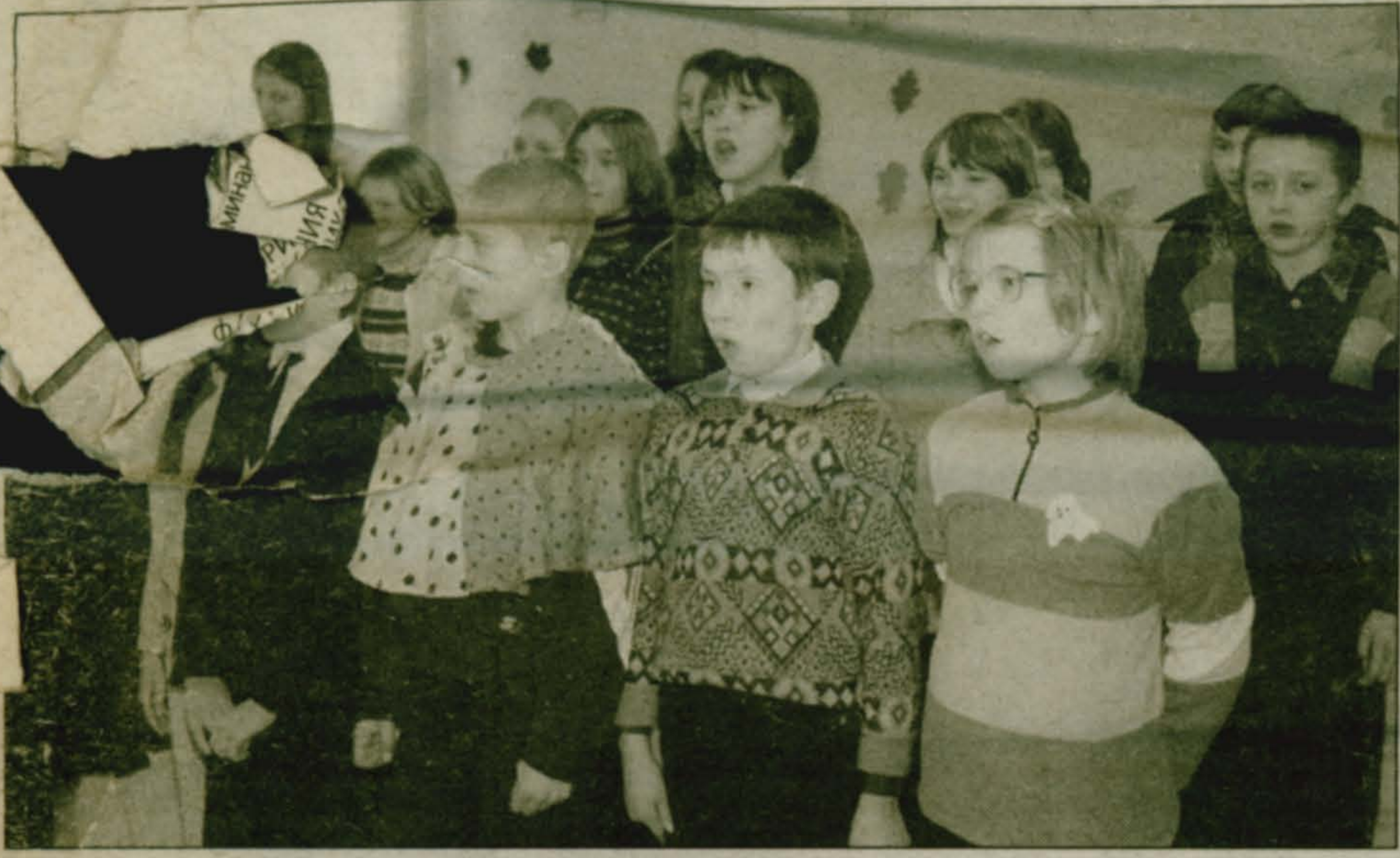
люди и судьбы