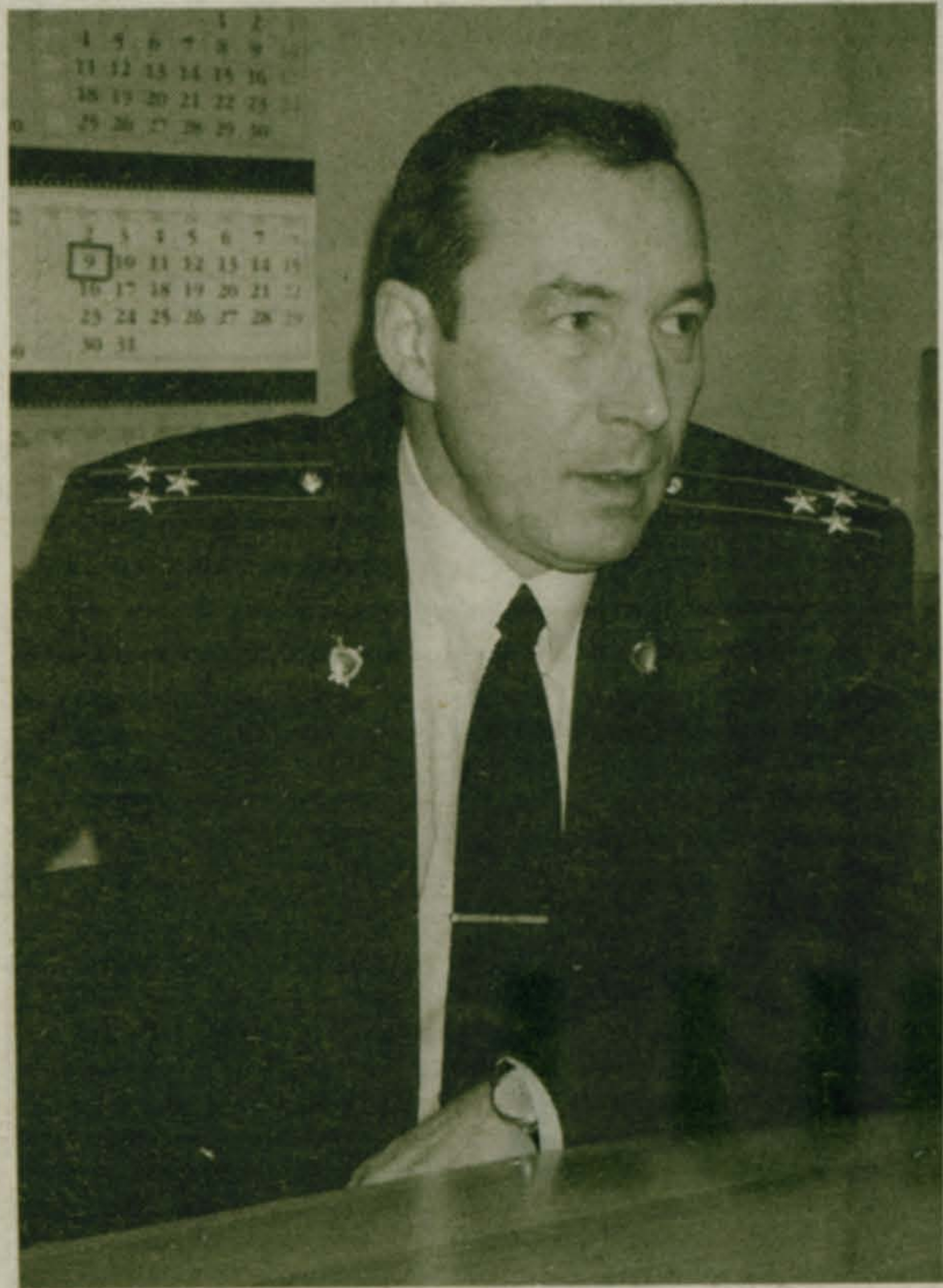
12 ЯНВАРЯ РОССИЙСКАЯ ПРОКУРАТУРА ОТМЕЧАЕТ 280 ЛЕТ СО ДНЯ ЕЕ ОБРАЗОВАНИЯ ПЕТРОМ I КАК ОРГАНА ГОСУДАРСТВЕННОЙ ВЛАСТИ

Что же представляет собой прокуратура сегодня? Здесь будет уместным заглянуть немного вперед и сказать, что уже в июле 2002 года вступит в действие Уголовно-процессуальный кодекс РФ. В первую очередь это говорит о том, что бесконечные дискуссии о замене прокуратуры каким-то иным правовым институтом или же о ее становлении придатком Министерства юстиции полностью исчерпали себя. Именно на этот орган сейчас делают большую ставку как на наиболее эффективно надзирающий за исполнением законов в стране, борющийся с преступностью, обеспечивающий реализацию принципа неотвратимости наказания.