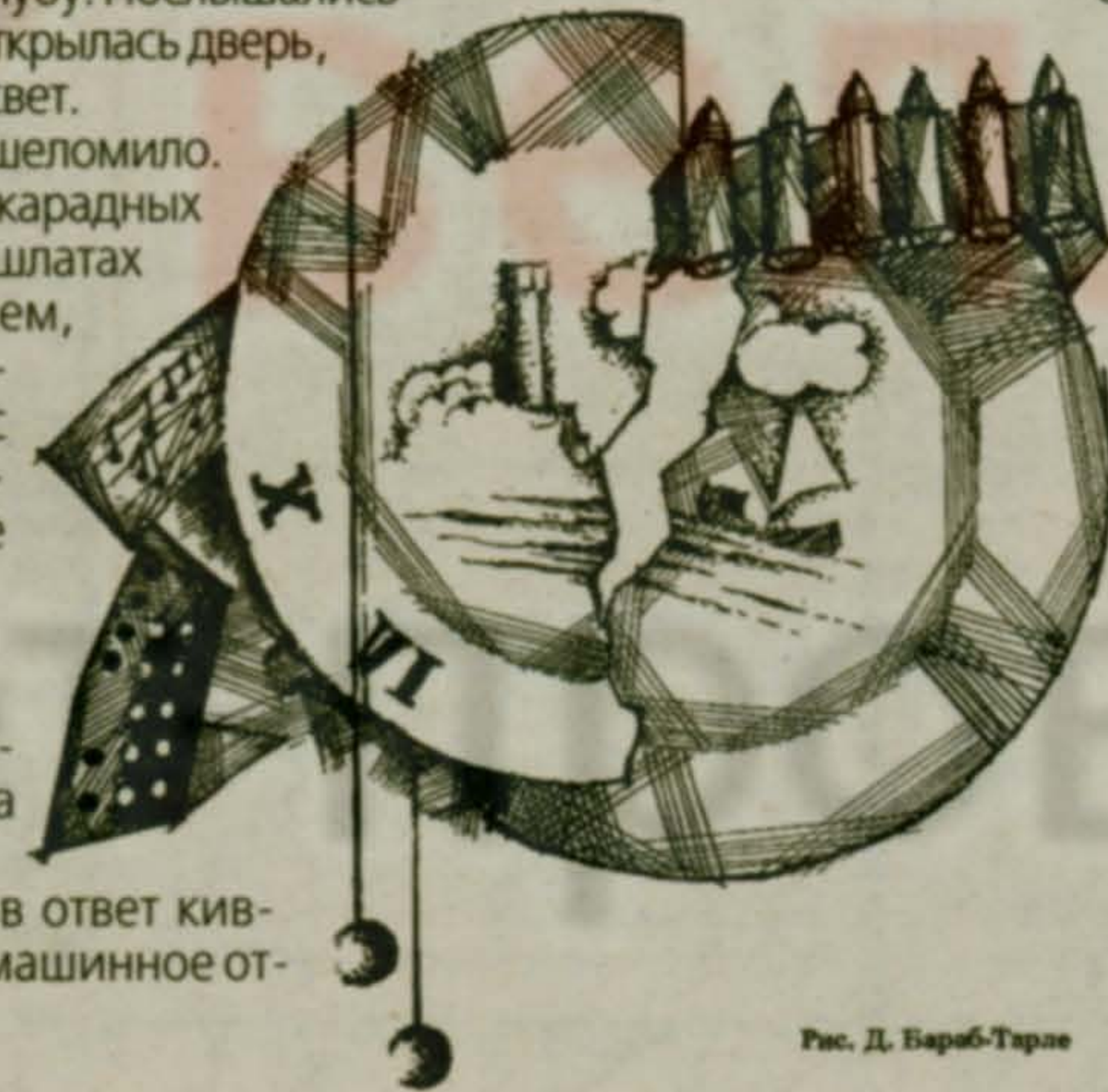
Рис. Д. Барыб-Таран

Андрей недоуменно в ответ кивнул, и его проводили в машинное отделение.