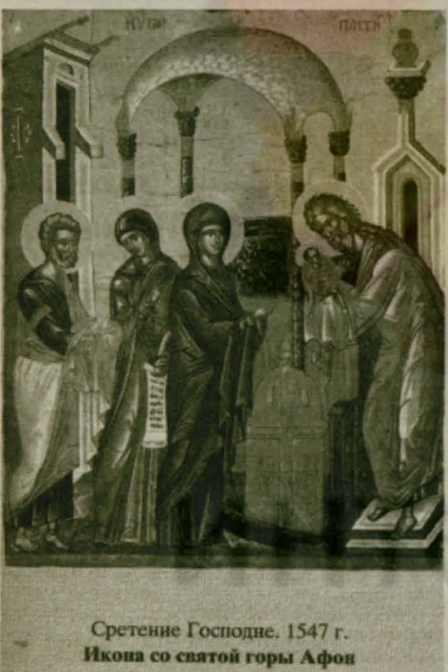
Сретение Господне. 1547 г. Икона со святой горы Афон