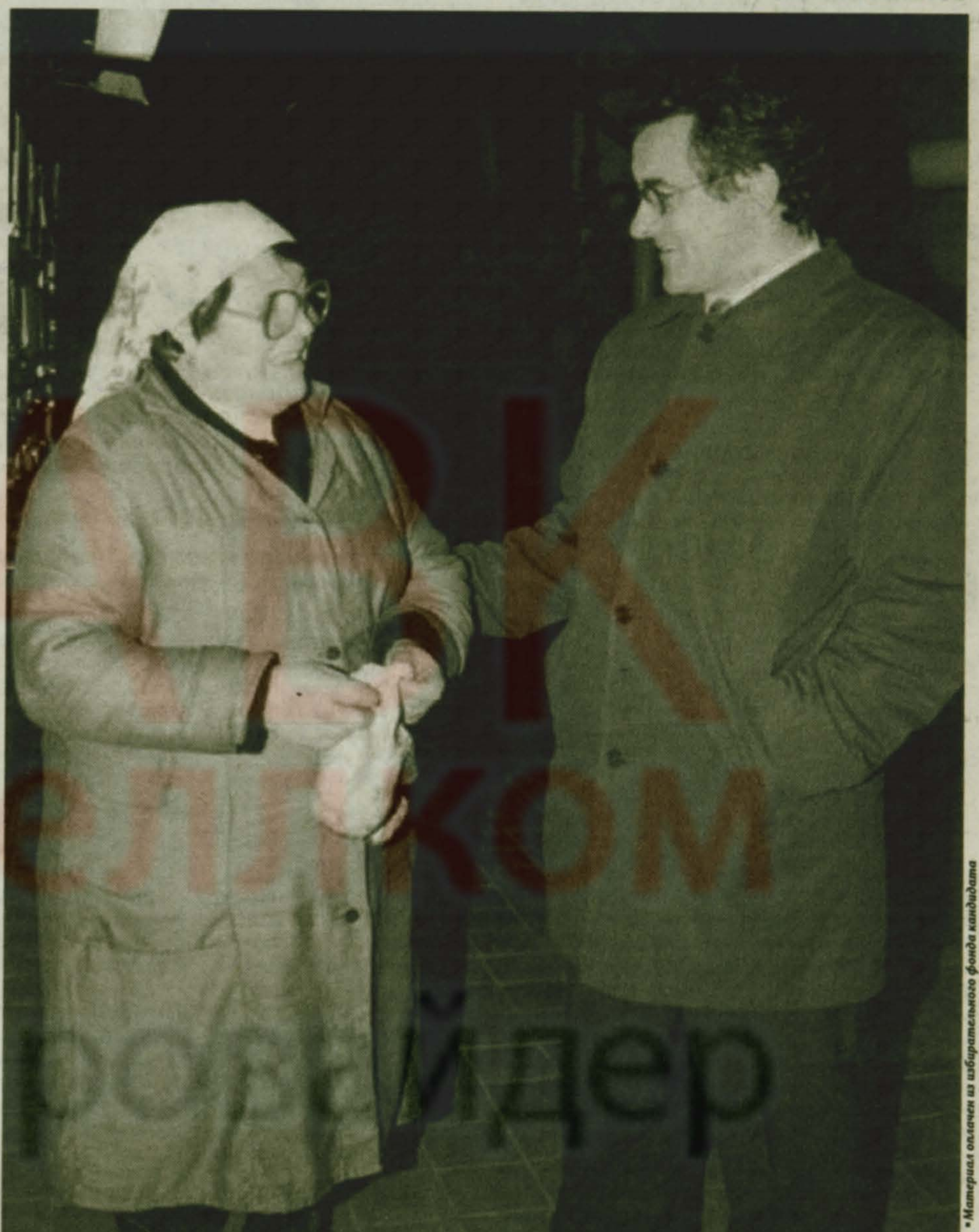
*Материал собран из избирательского фонда кандидата