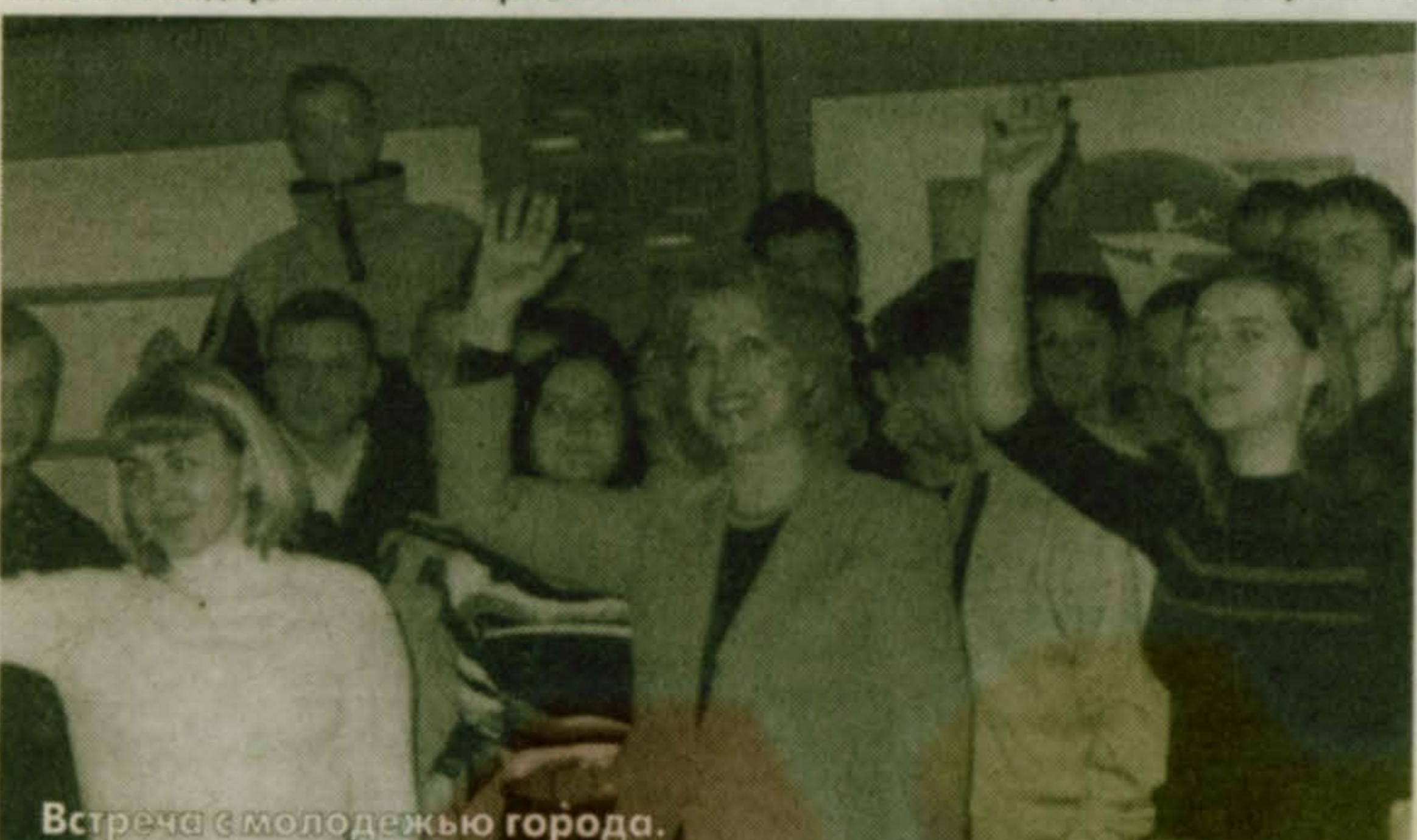
Встреча с молодежью города.