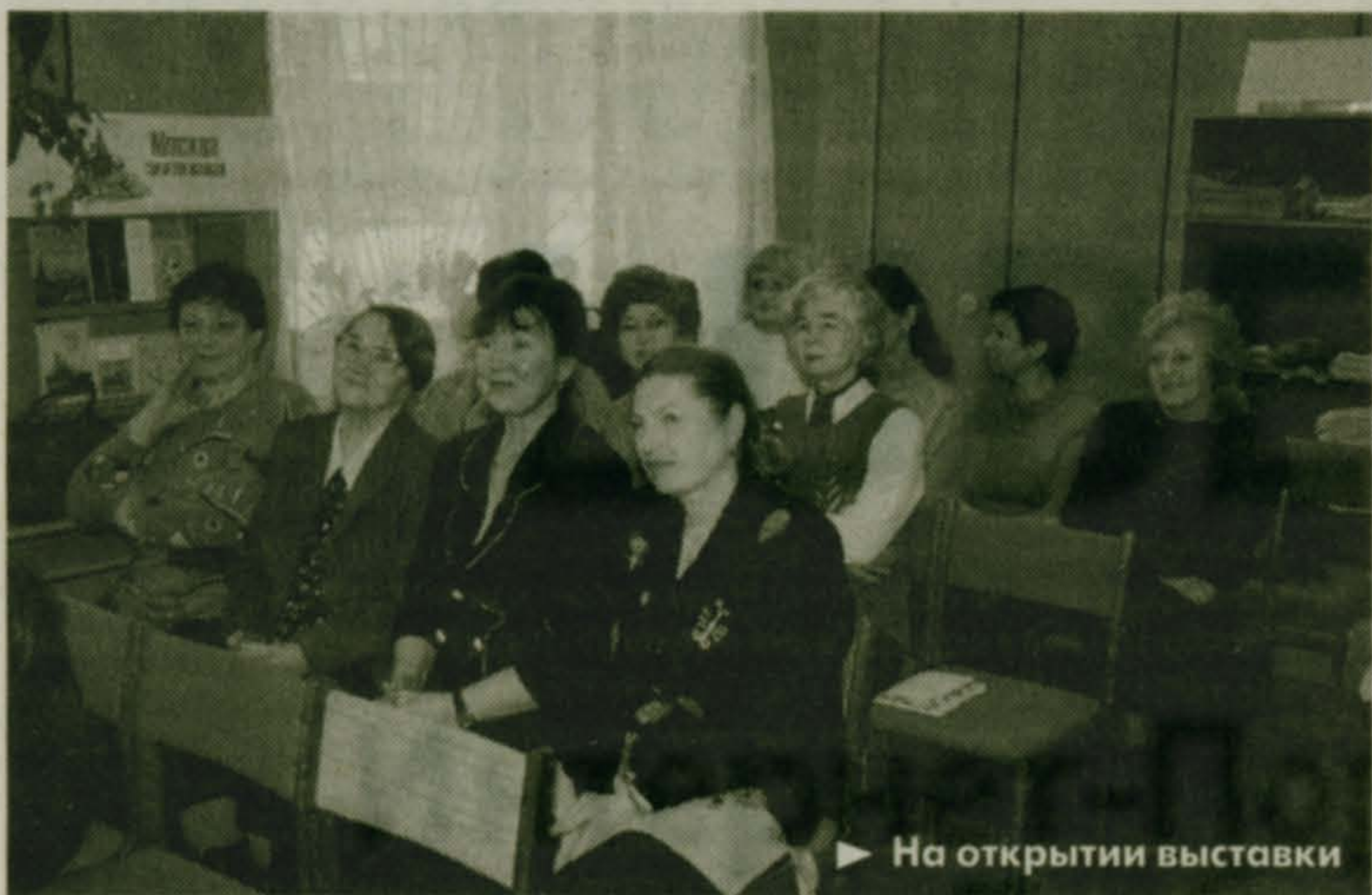
▶ На открытии выставки

На днях открылась после реконструкции и капитального ремонта городская библиотека-филиал № 12. Библиотека имеет давнюю и славную историю, так как является старейшей библиотекой города. Открыта она была в 20-х годах прошлого столетия при Люберецком заводе сельскохозяйственных машин им. Ухтомского.