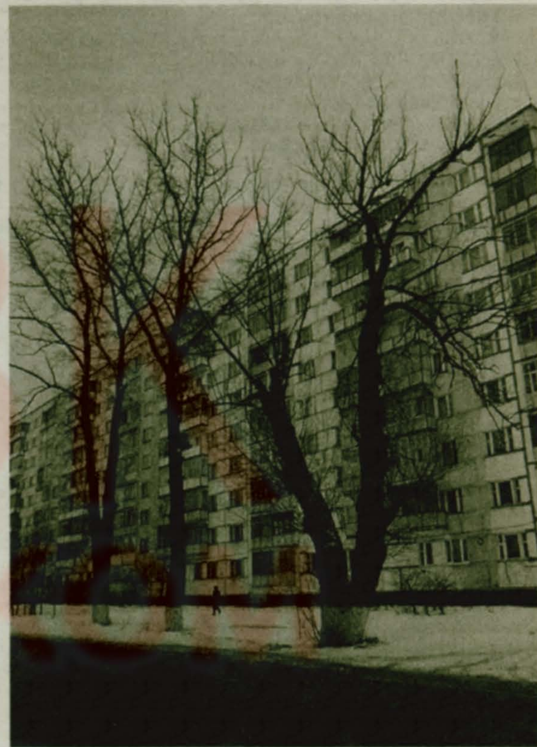
■ Улица Митрофанова - своего рода "Невский проспект" Красной Горки. Только старая-престарая ветла у дороги помнит еще, наверное, те времена, когда была Красная Горка дачной местностью и модно одетые дачники совершали свой неперенный "променад" к Наташинскому парку и прудам.

Мне захотелось проверить, точно ли я цитирую стихотворение. Проверил по нескольким сборникам. Увы, в позднейших изданиях искомым слов нет, они отброшены. Книжки выходили в разгар антиалкогольных кампаний и цензоры в спешке убили всяческое упоминание о рябиновом напитке.