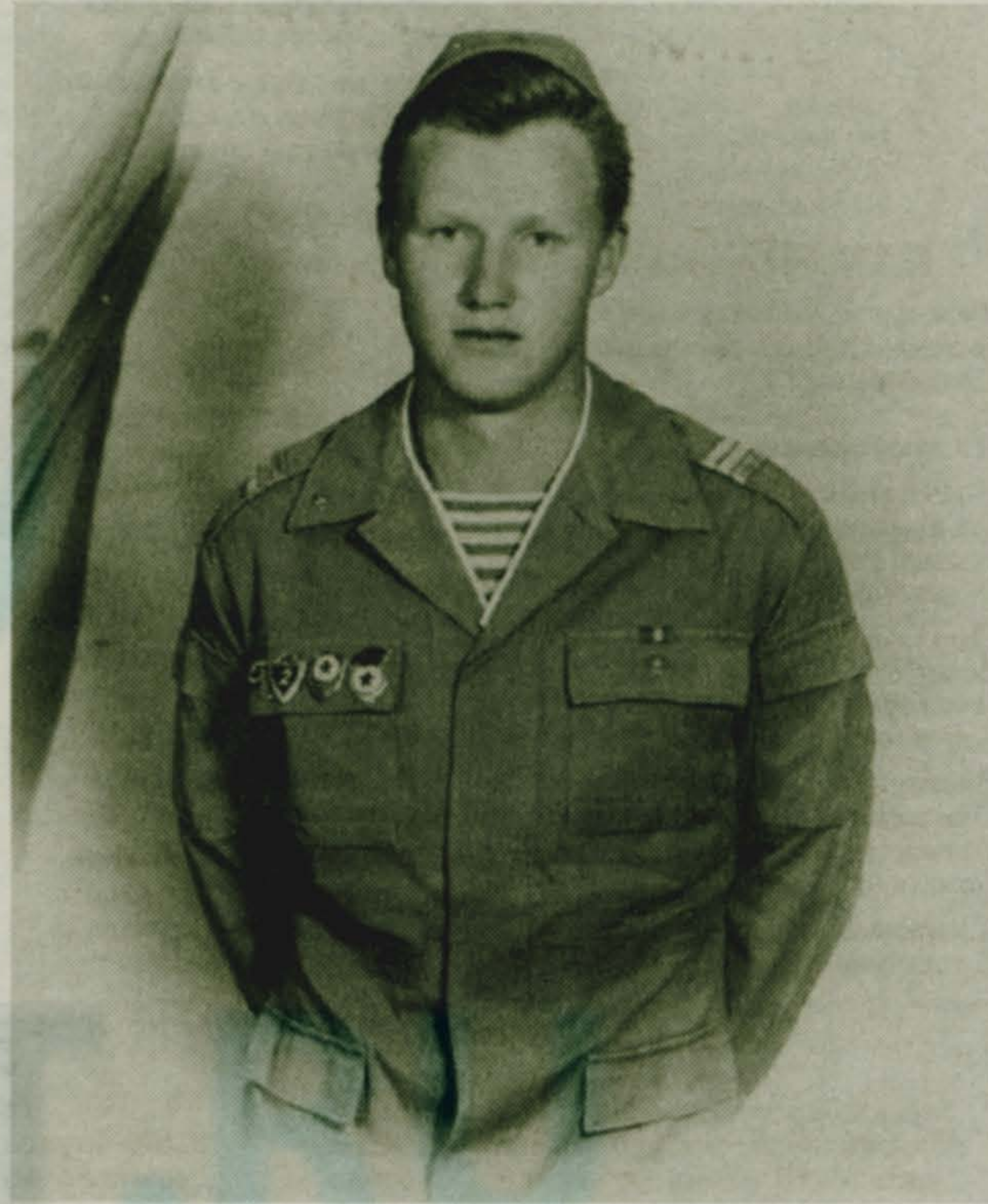
ший инженер, командир группы, главный инженер полка. Нес боевое дежурство - был командиром дежурных сил.

- А что интересного? С двумя моими сыновьями меня объединяет служба в армии. Мой путь - от курсанта до подполковника, за 26 лет. Если коротко, то служил в авиации - в 22 года выпускал в полет самолет ТУ-4, изучал реактивный самолет ТУ-16, был инженером-испытателем на космодроме Плесецк в Архангельской области, где участвовал в отладке нового ракетного комплекса и запуске ракет, в испытании ракетных двигателей, в снятии ракет с боевого дежурства и установке нового комплекса. "Должностная лестница" - стар-