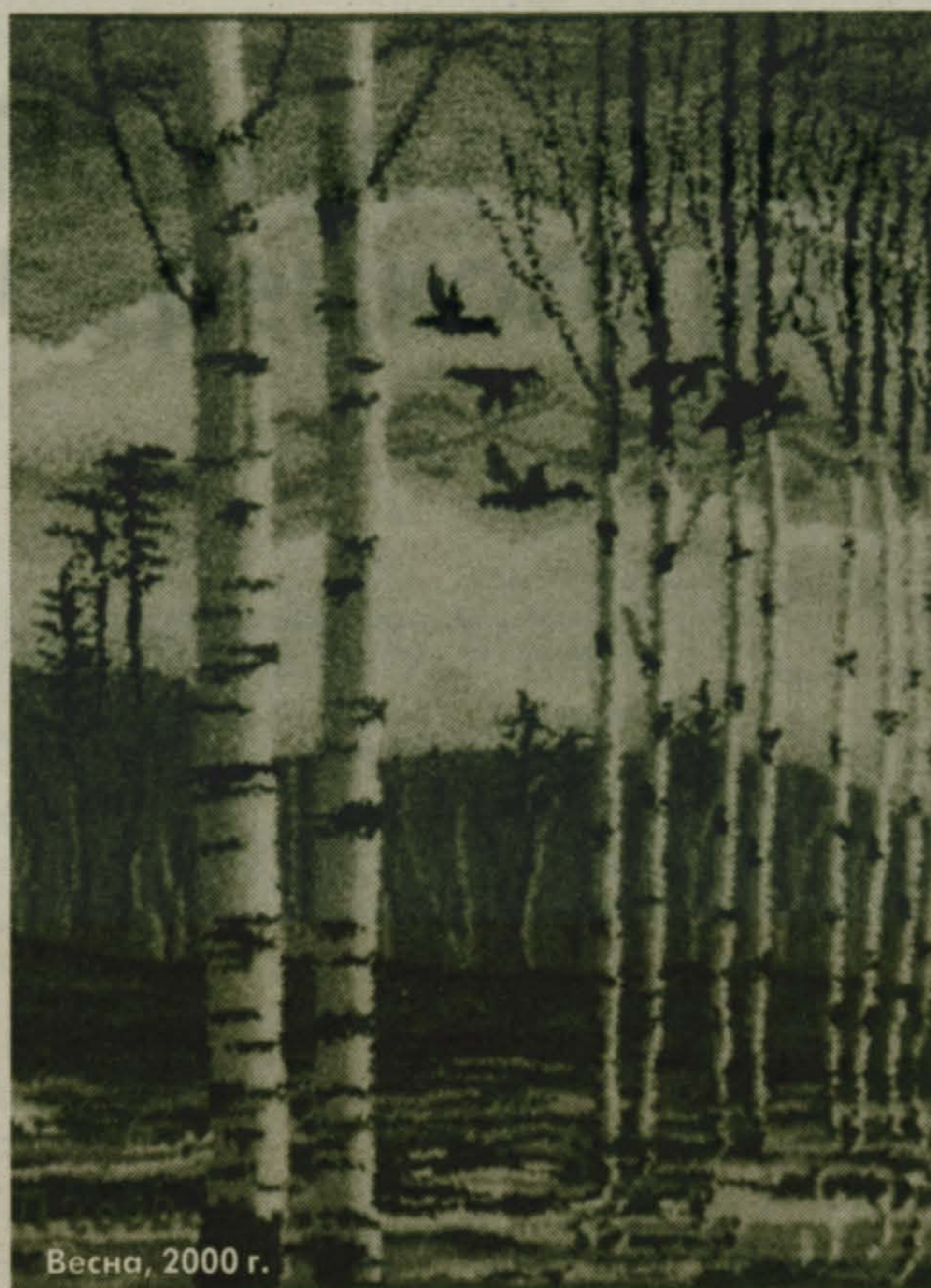
Весна, 2000 г.

- Прежде придумывала сама, а теперь появилось желание копировать любимых художников. Это не просто школа, но большая радость, а вместе с ней - ответственность. Последняя работа - "Красный виноградник" Ван Гога - трудно давалась. Яркий материал. Яркая гамма цве-