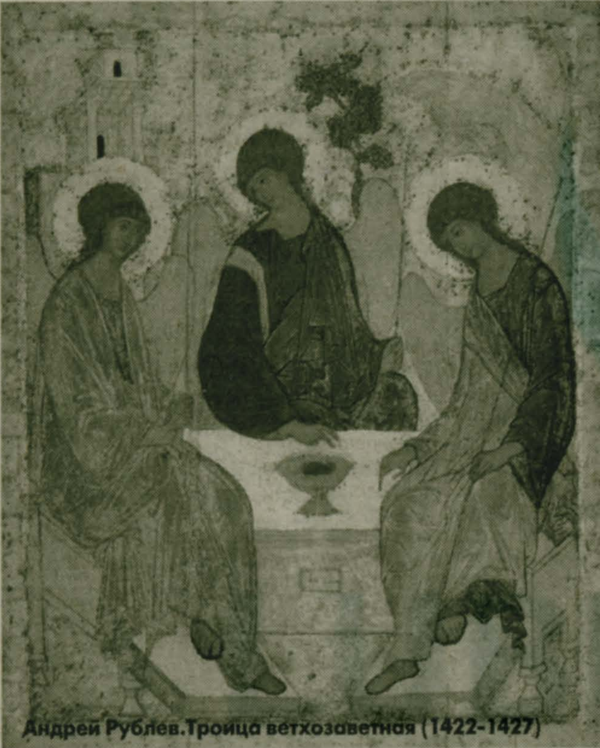
Андрей Рублев. Троица ветхозаветная (1422-1427)