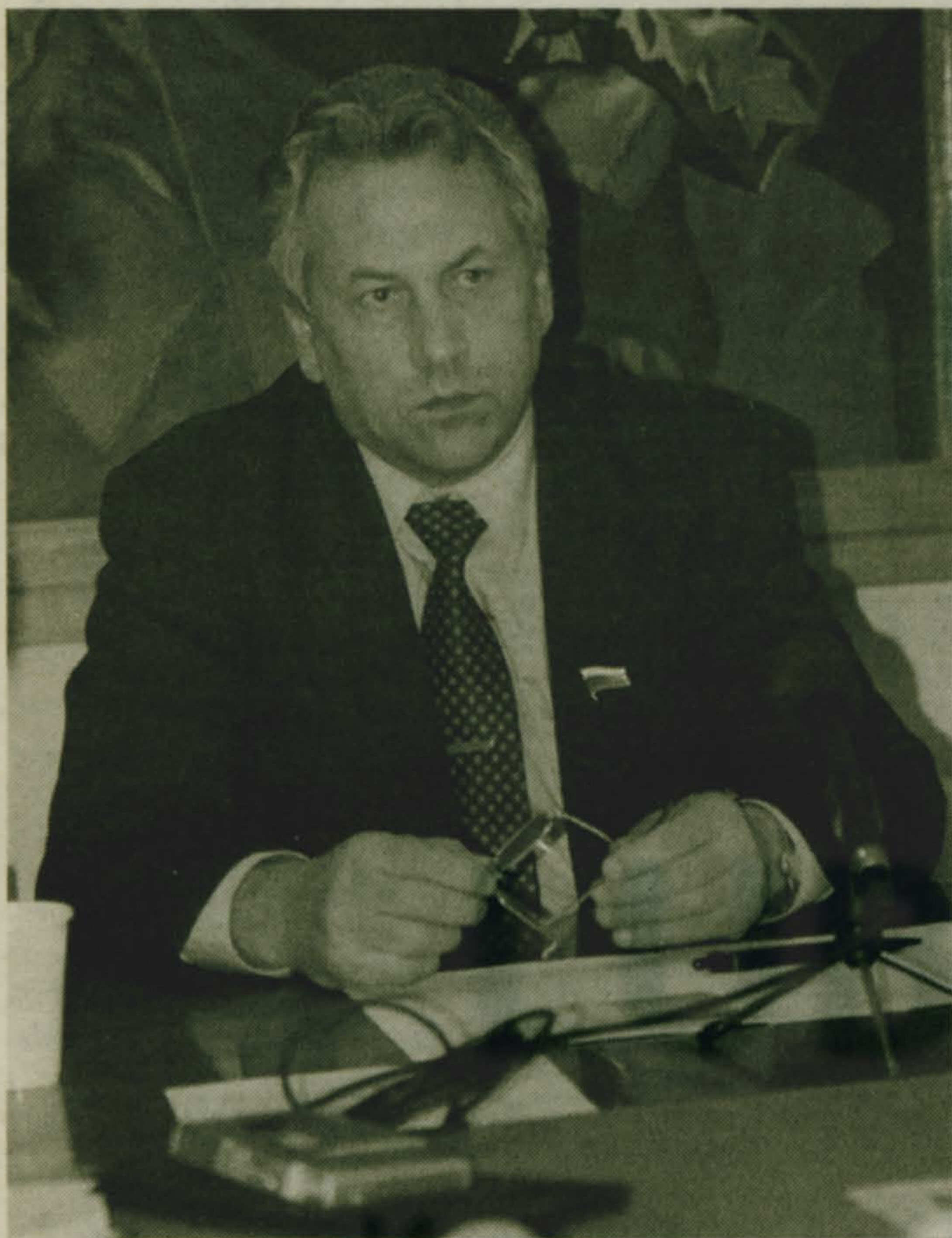
Юрий Александрович, вы - председатель рабочей группы по подготовке закона "Об электроэнергетике". Почему Госдума отложила рассмотрение законопроекта на осень?

Говоря коротко, я бы сказал: у депутатов не было достаточно времени, чтобы ознакомиться с документами. Кроме того, считаю, что правительство слишком затянуло с внесением законопроекта в Госдуму и за оставшееся время не успело разъяснить депутатам саму суть реформы.