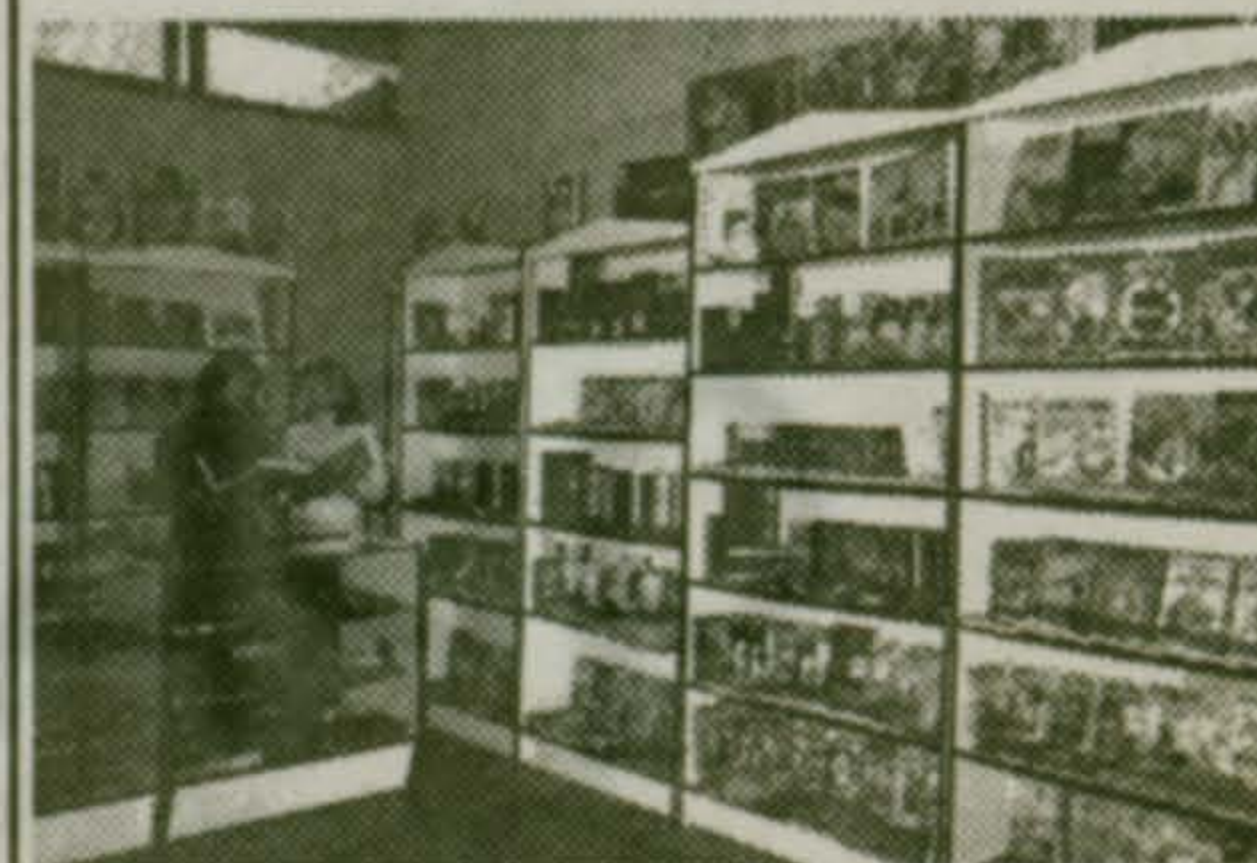
Требуются продавцы на лоток.

открылся в киноцентре «Союз» - Большой выбор художественной, научно-популярной и детской литературы. - Канцелярские товары для школ и офисов. - Услуги ксерокопирования. Работаем без выходных. Пн.-Пт. - 10.00-19.30 Выходные - 10.00 - 17.30 Тел. 551-11-90