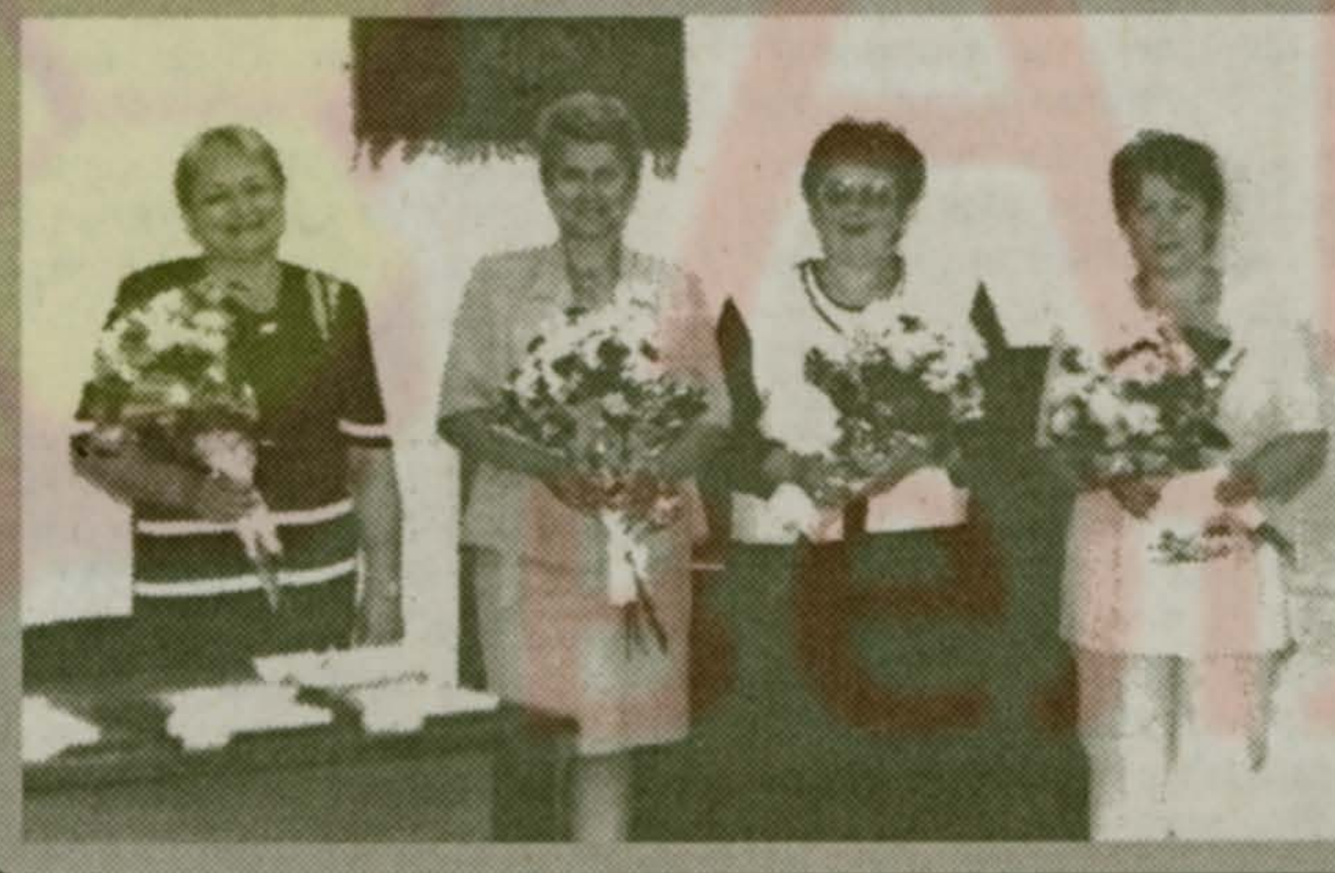
Фото и текст П.Сажина

И даже небольшой фуршет потом был. И настроение у любимых наших медицинских работников было отличное. А хорошее настроение врачей, уверяем вас, отразится и на нашем с вами здоровье. В лучшую сторону, понятно.