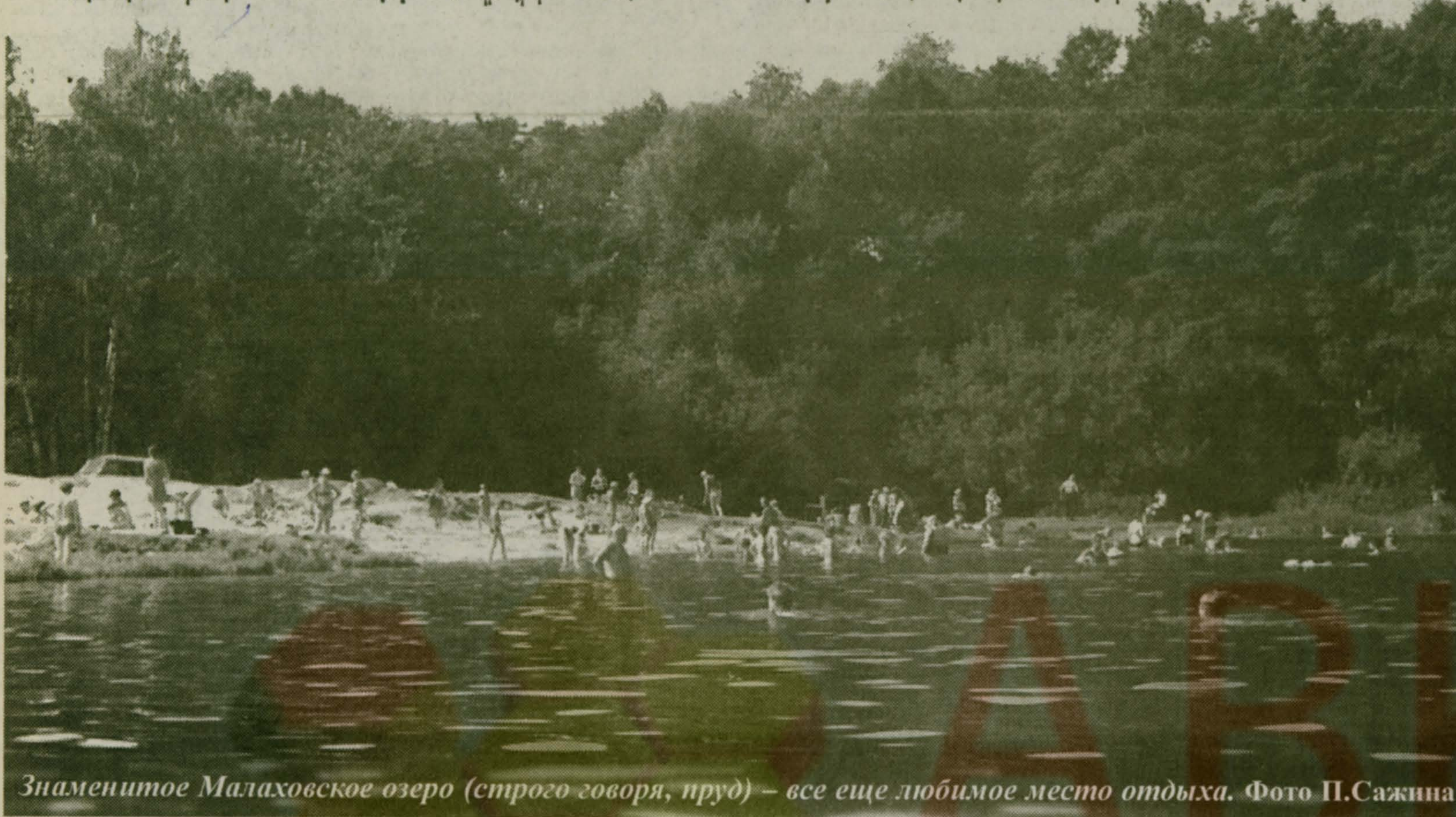
Знаменитое Малаховское озеро (строго говоря, пруд) – все еще любимое место отдыха.