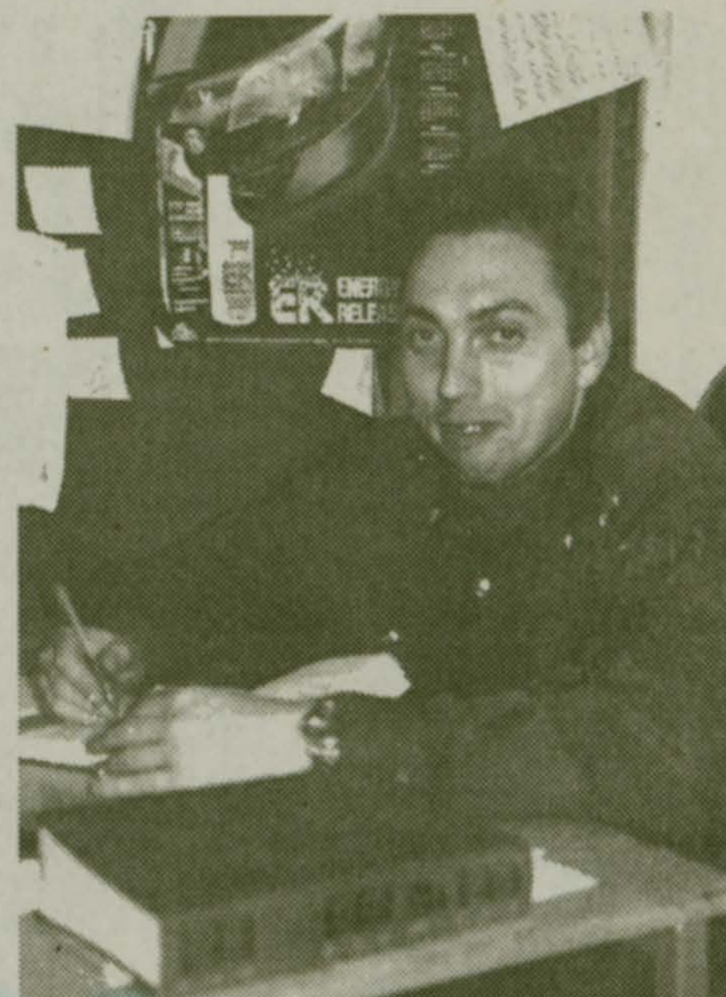
Беседовал М.Плотинцын

му «Мастер» нас сначала не хотели пускать. Мы могли бы на это отреагировать тем, что вызвали ОМОН. Вдруг у них укрываются террористы? Но потом вышел начальник службы безопасности и провел нас по всем цехам. У всех работников с документами оказалось все в порядке. – Интересно, как это все можно втиснуть в один рабочий день? – Не знаю, пока это вроде получается. – А кстати, что такое для тебя День милиции? – Этот день для меня и для моих коллег, конечно, праздник. А еще хорошо то, что хотя бы в этот день люди помнят нас добрым словом и благодарят за то, что мы делаем. Хотя раз в год о милиции вспоминают с хорошей стороны.