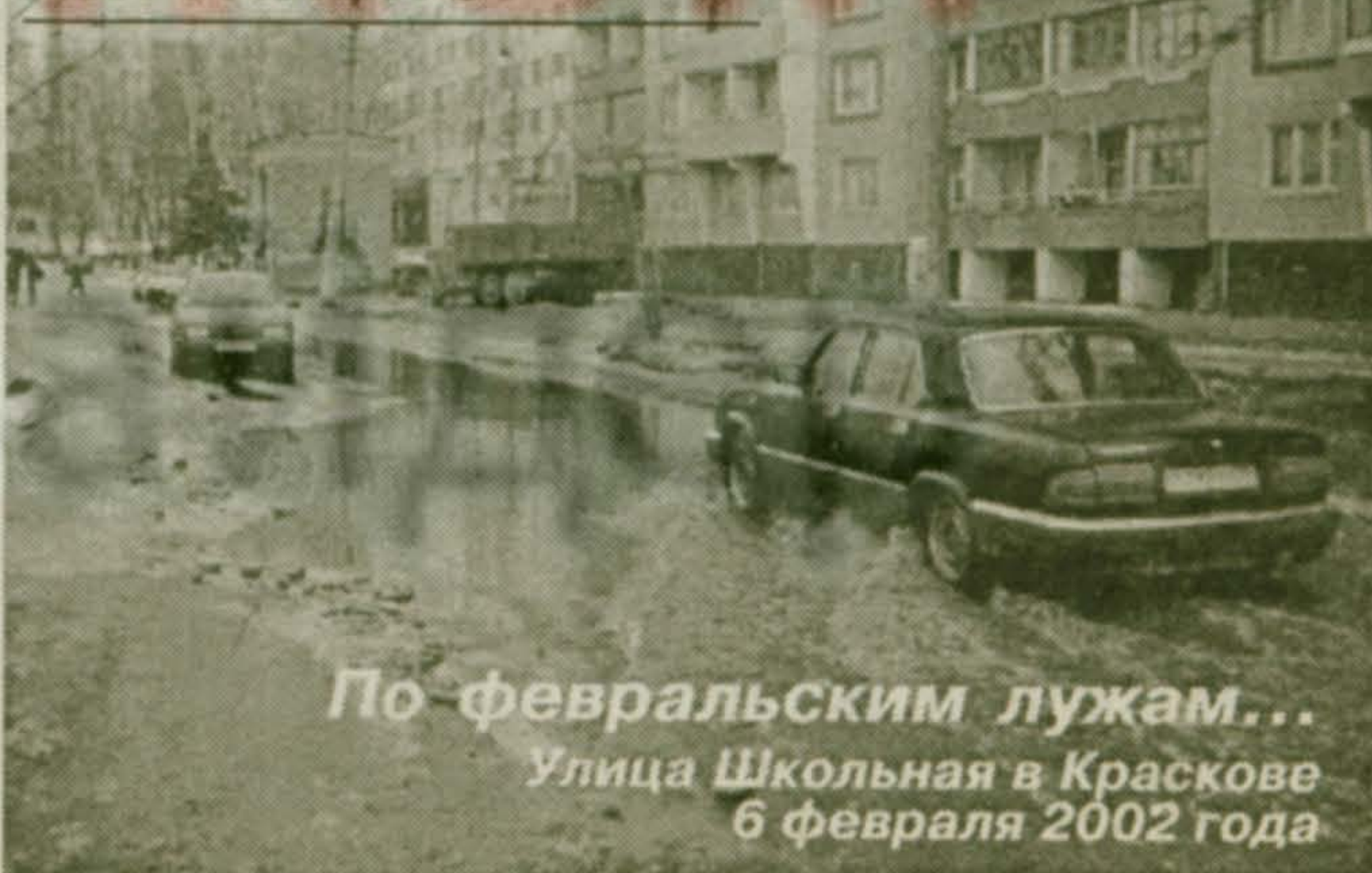
По февральским лужам... Улица Школьная в Краскове 6 февраля 2002 года