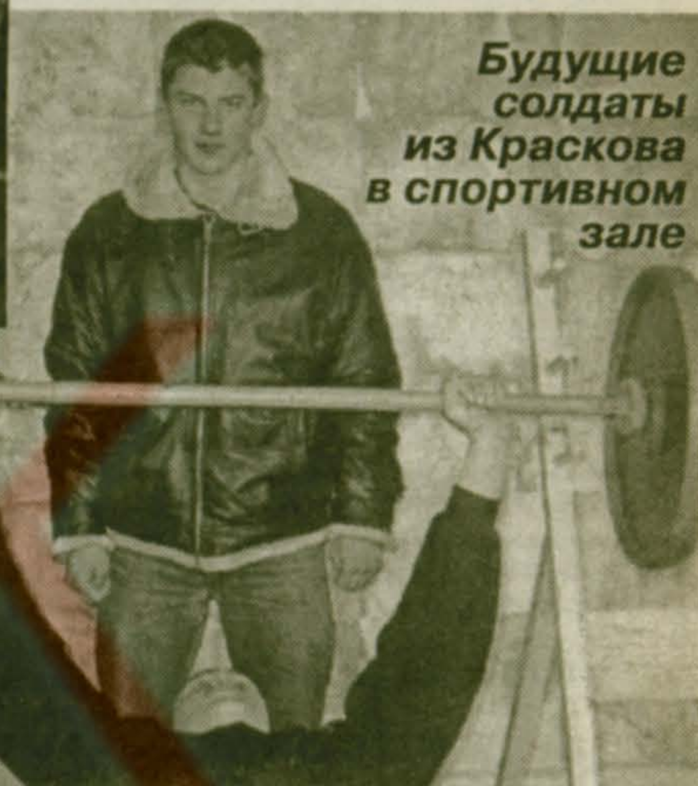
Будущие солдаты из Краскова в спортивном зале

лени доходов и расходов бюджета и поступлений из источников финансирования дефицита бюджета, устанавливающий распределение бюджетных ассигнований между получателями бюджетных средств и составляемый в соответствии с бюджетной классификацией Российской Федерации;