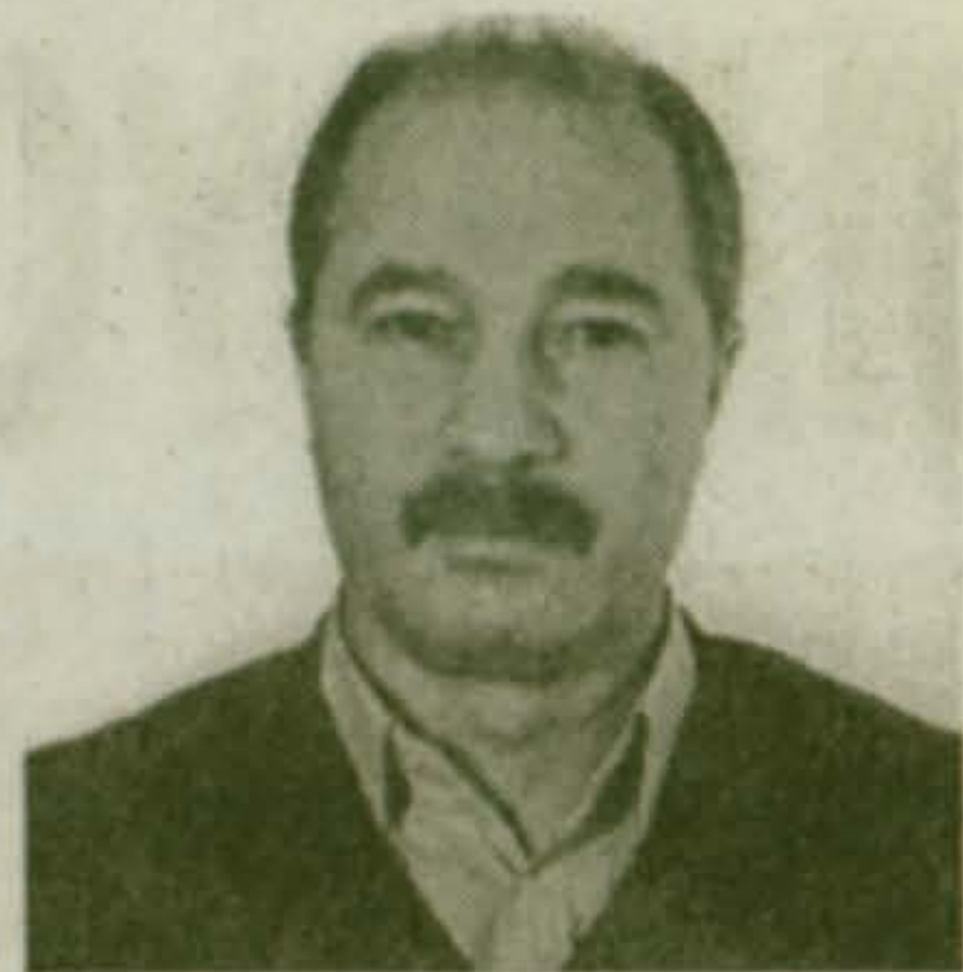
Уважаемые Одиссей Алексеевич и Геракл Алексеевич!