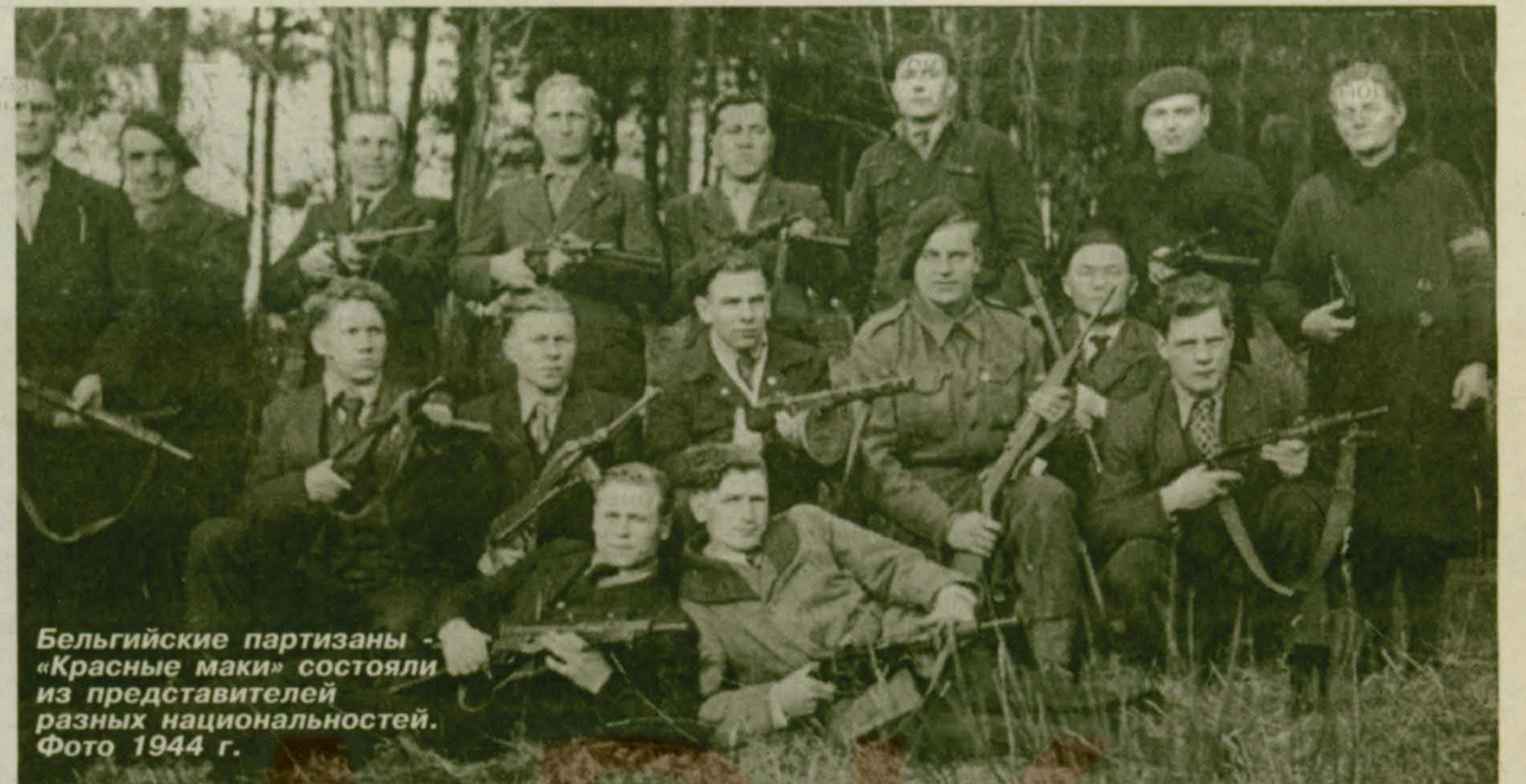
Бельгийские партизаны «Красные маки» состояли из представителей разных национальностей. Фото 1944 г.

вать их под основание моста. Место было сухое, для «цемента» лучше не найти, установили несколько взрывателей и часовые механизмы, все накрыли сверху рубероидом, чтобы в случае дождя наш «цемент» не замочило, и привалили кирпичами рубероид, чтобы не сдуло. Из грузовика достали носилки, стали собирать мусор и битый кирпич в местах, где нужно совершить ремонтные работы. Часовой механизм поставили на полночь, когда по мосту шли грузные техникой военные эшелоны немцев.