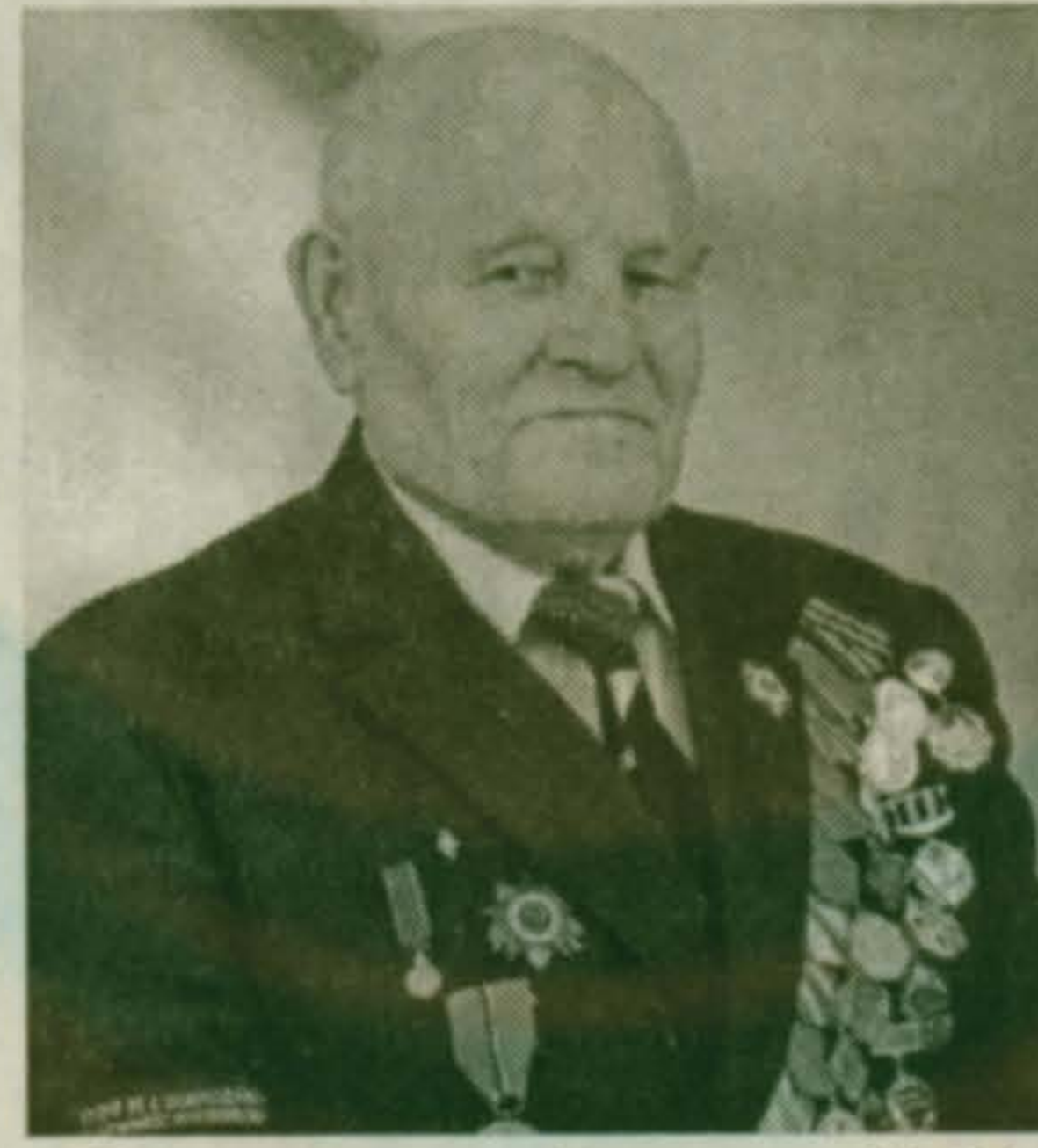
Продолжение. Начало в №17