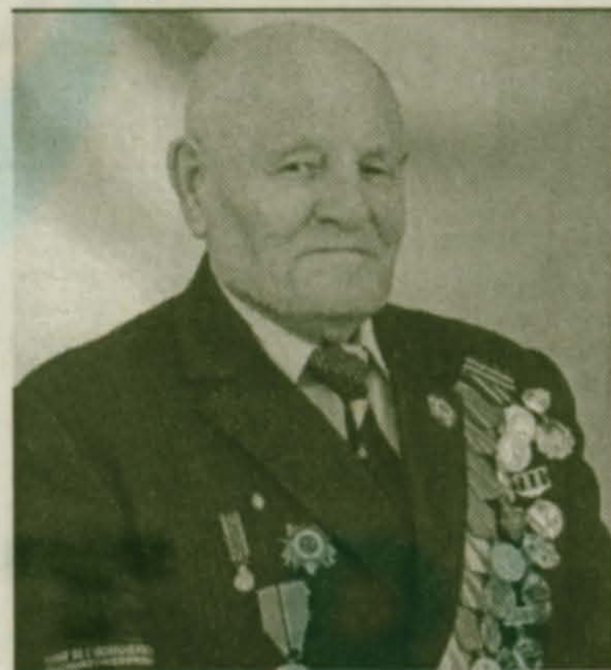
Продолжение. Начало в №17, 19

В апреле 1945 года я переехал в Брюссель, жил на улице Рюль-Де-Факс более двух недель, здесь находился сборный пункт для советских военнопленных. Огромное красивое здание, в нем были баня, столовая, спальни и даже красный уголок. Недалеко от нас, на улице Шандзелизей находилось Советское посольство, где я познакомился с нашим военным аташе - подполковником Мельниковым.