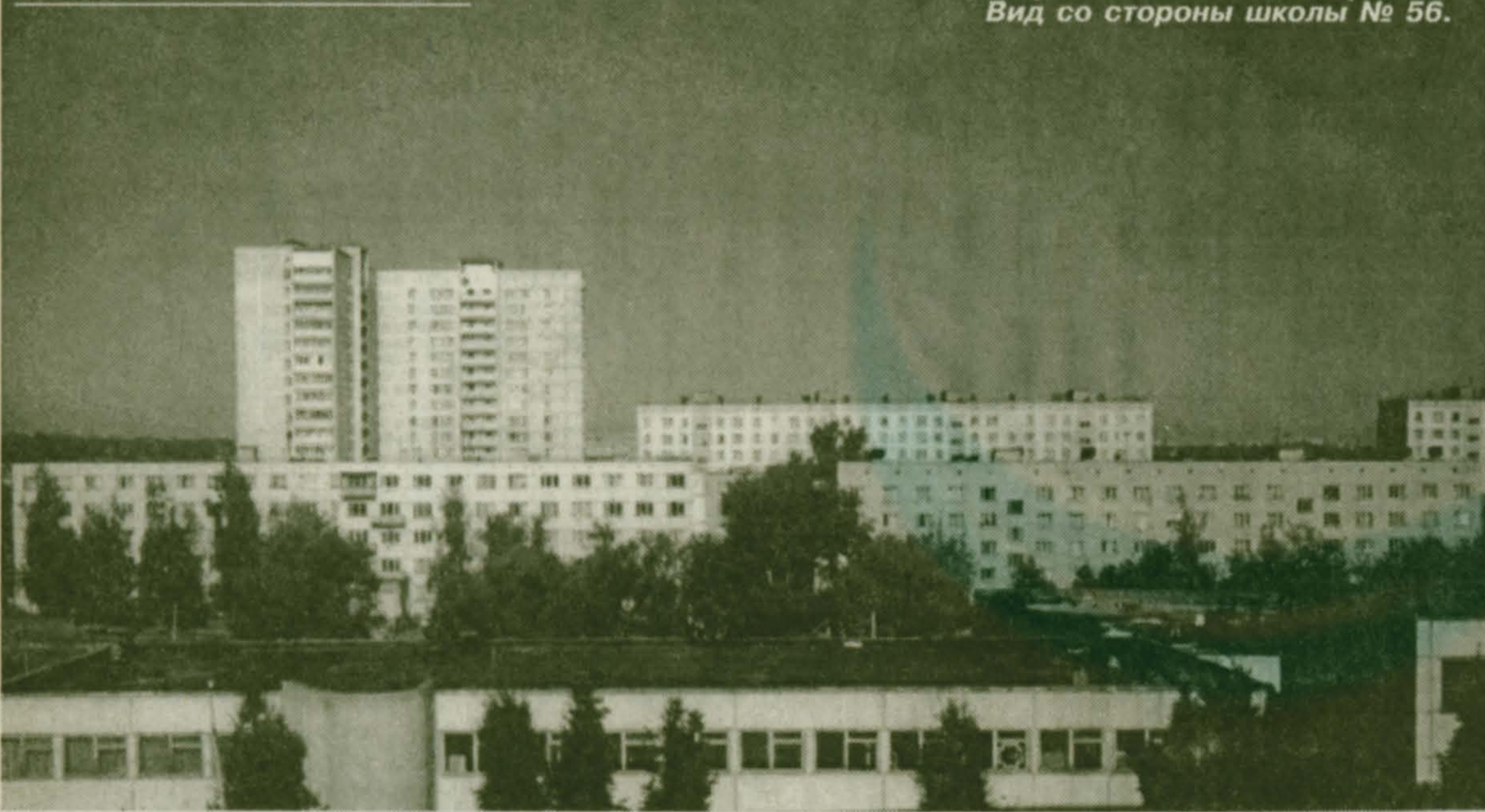
Красковские «небоскребы». Вид со стороны школы № 56.