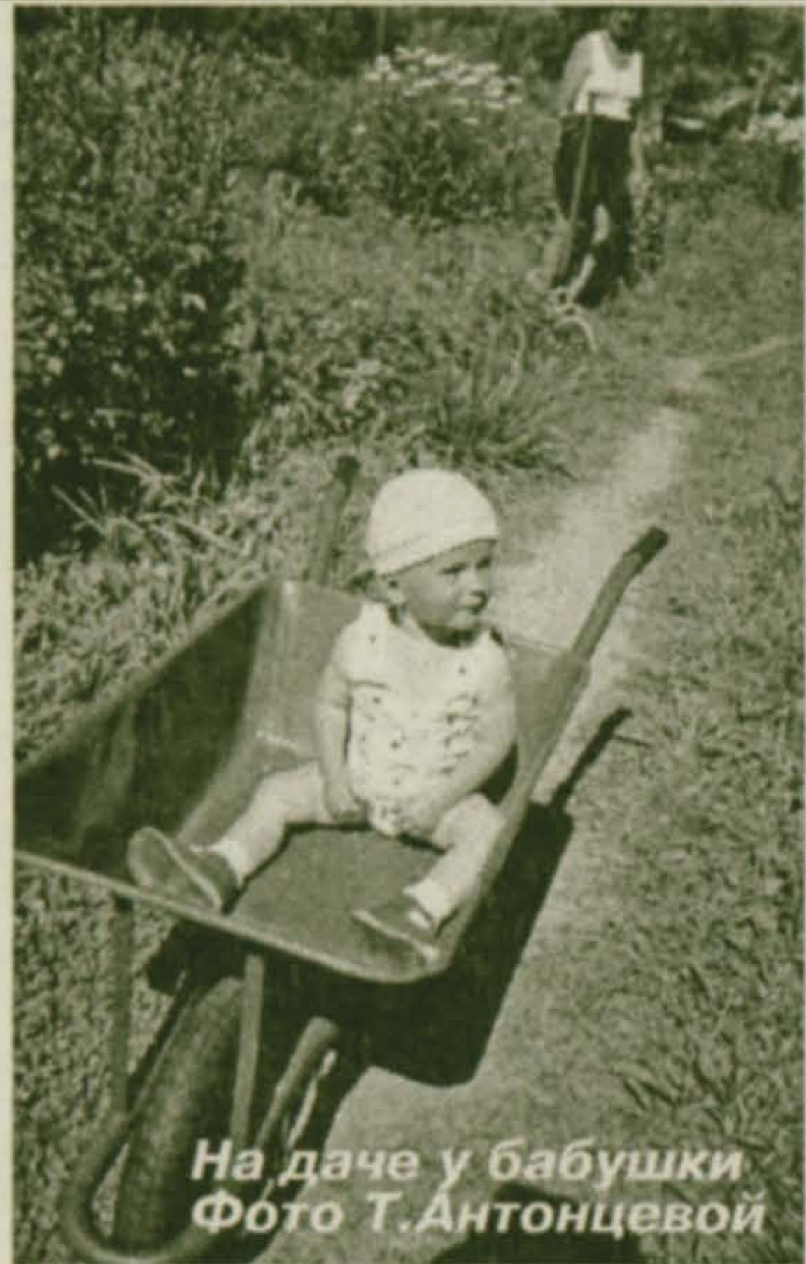
На даче у бабушки