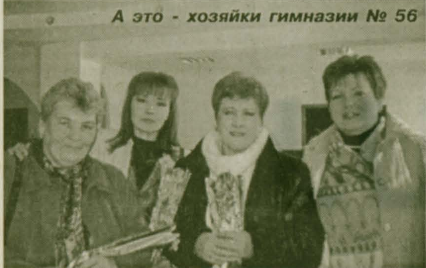
А это - хозяйки гимназии № 56