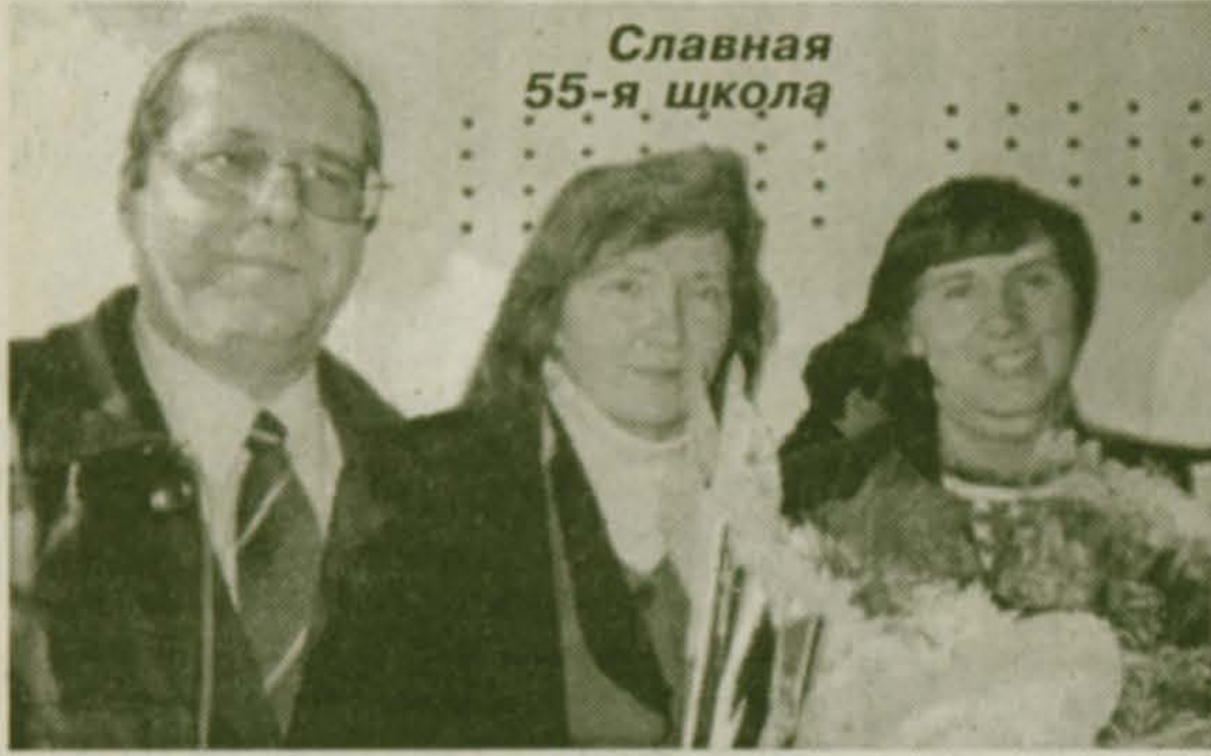
Славная 55-я школа