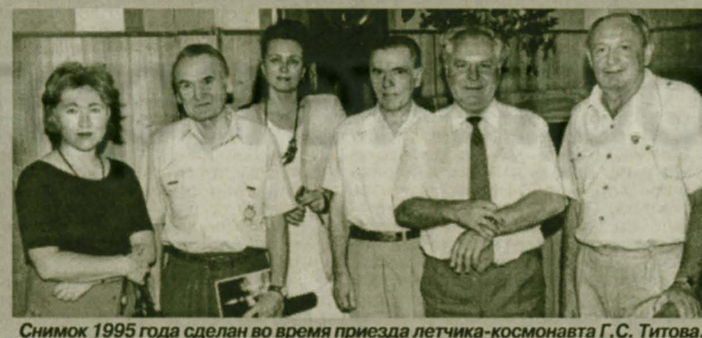
Снимок 1995 года сделан во время приезда летчика-космонавта Г.С. Титова.