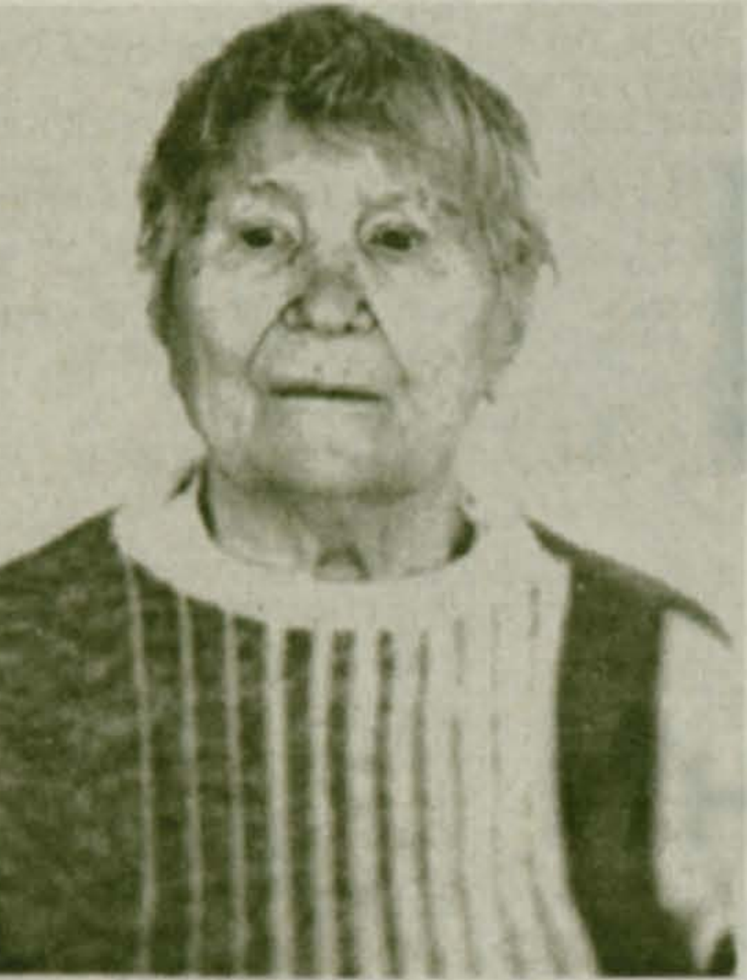
Окончание. Начало в № 45.

Центр развития ребенка - детский сад № 92 «Елочка» ПРИГЛАШАЕТ - воспитателей, - младших воспитателей. Обращаться лично или по тел. 501-81-01, доб. 2-39