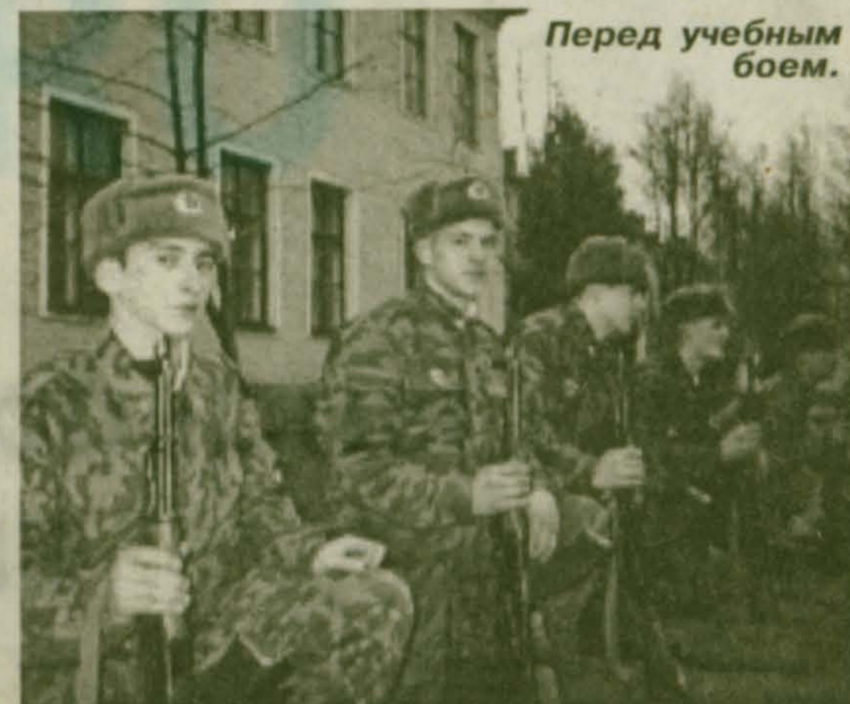
Перед учебным боем.