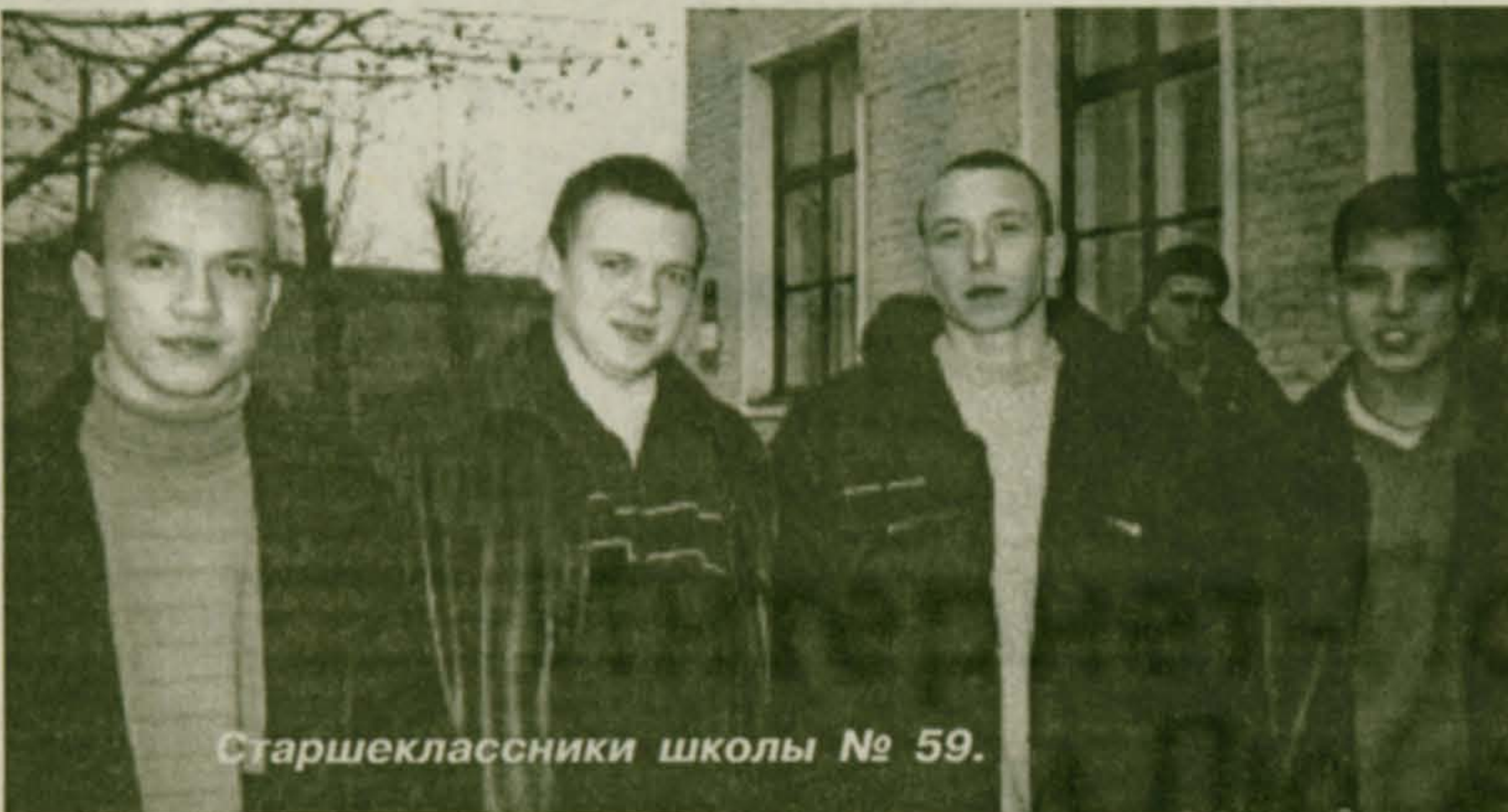
Старшеклассники школы № 59.