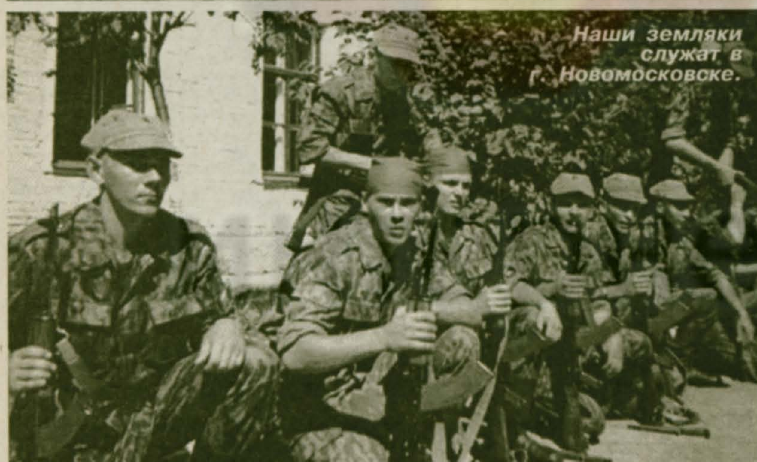
Наши земляки служат в Новомосковске.