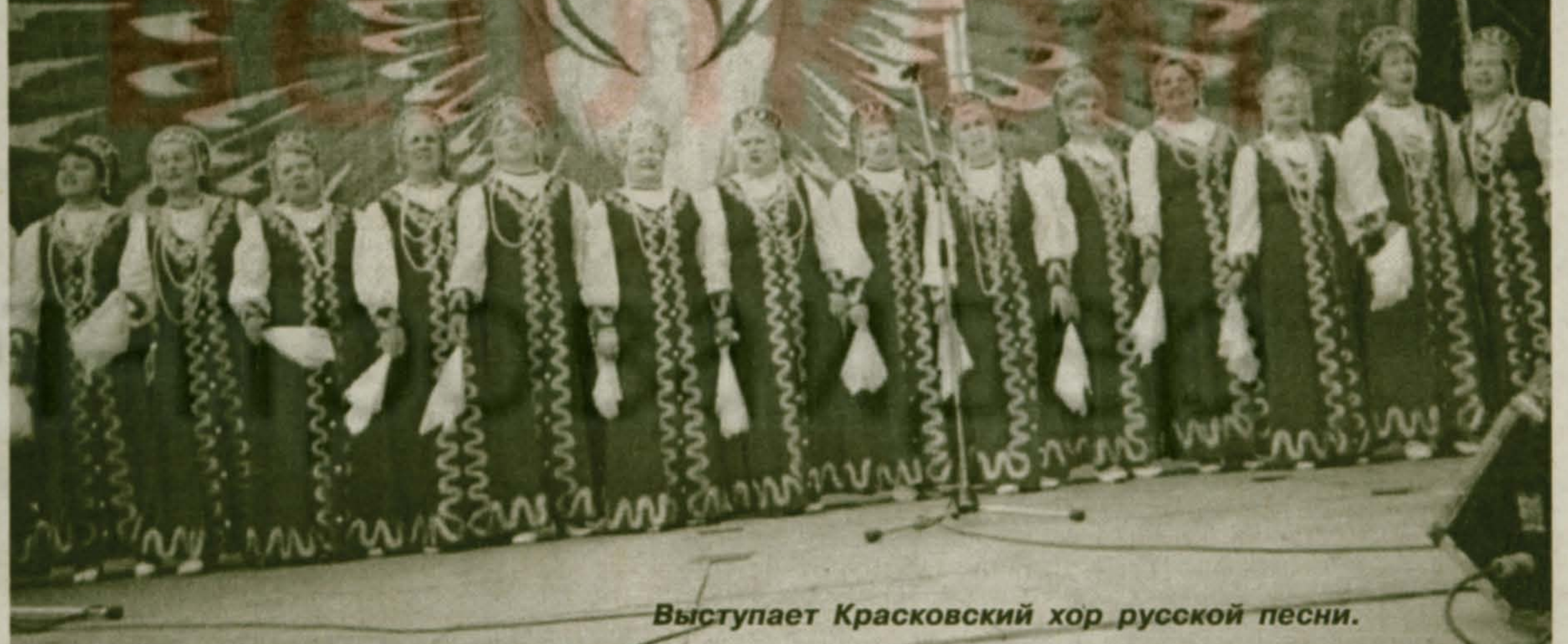
Выступает Красковский хор русской песни.