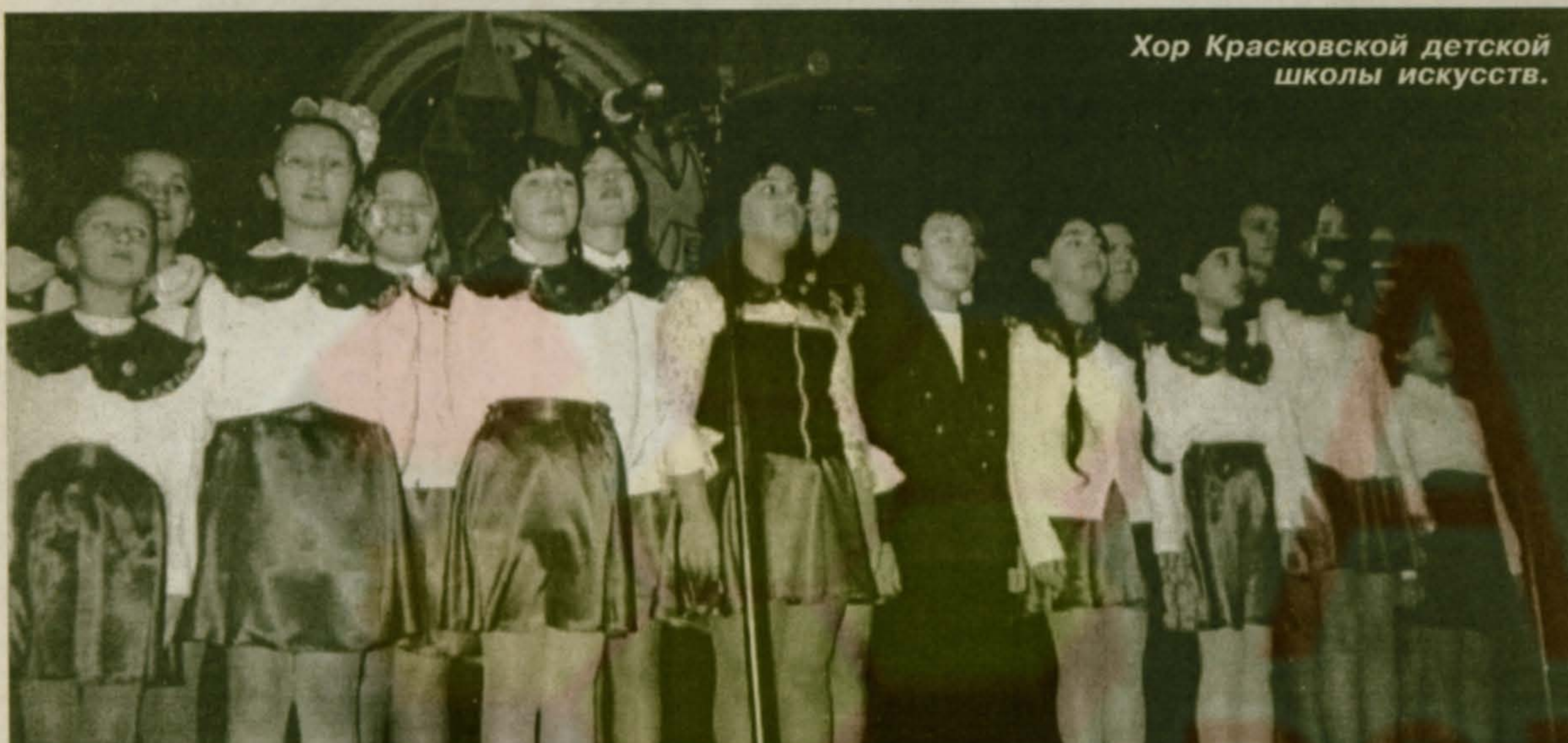
Хор Красковской детской школы искусств.