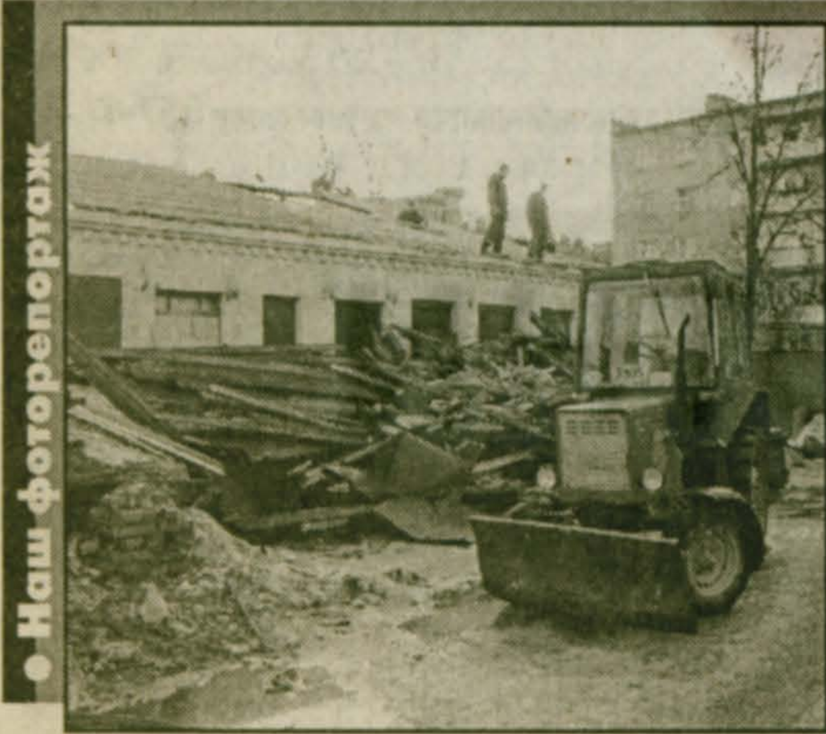
Полным ходом идут работы по восстановлению поселковой бани