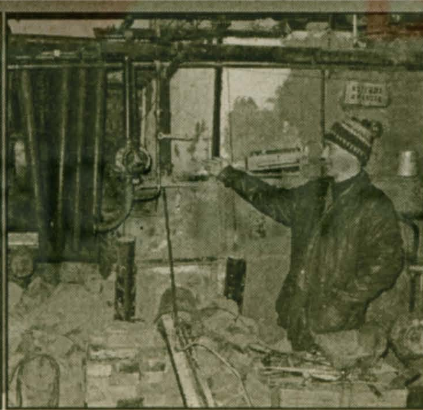
В котельной МУП «Благоустройства» идет замена старого котла