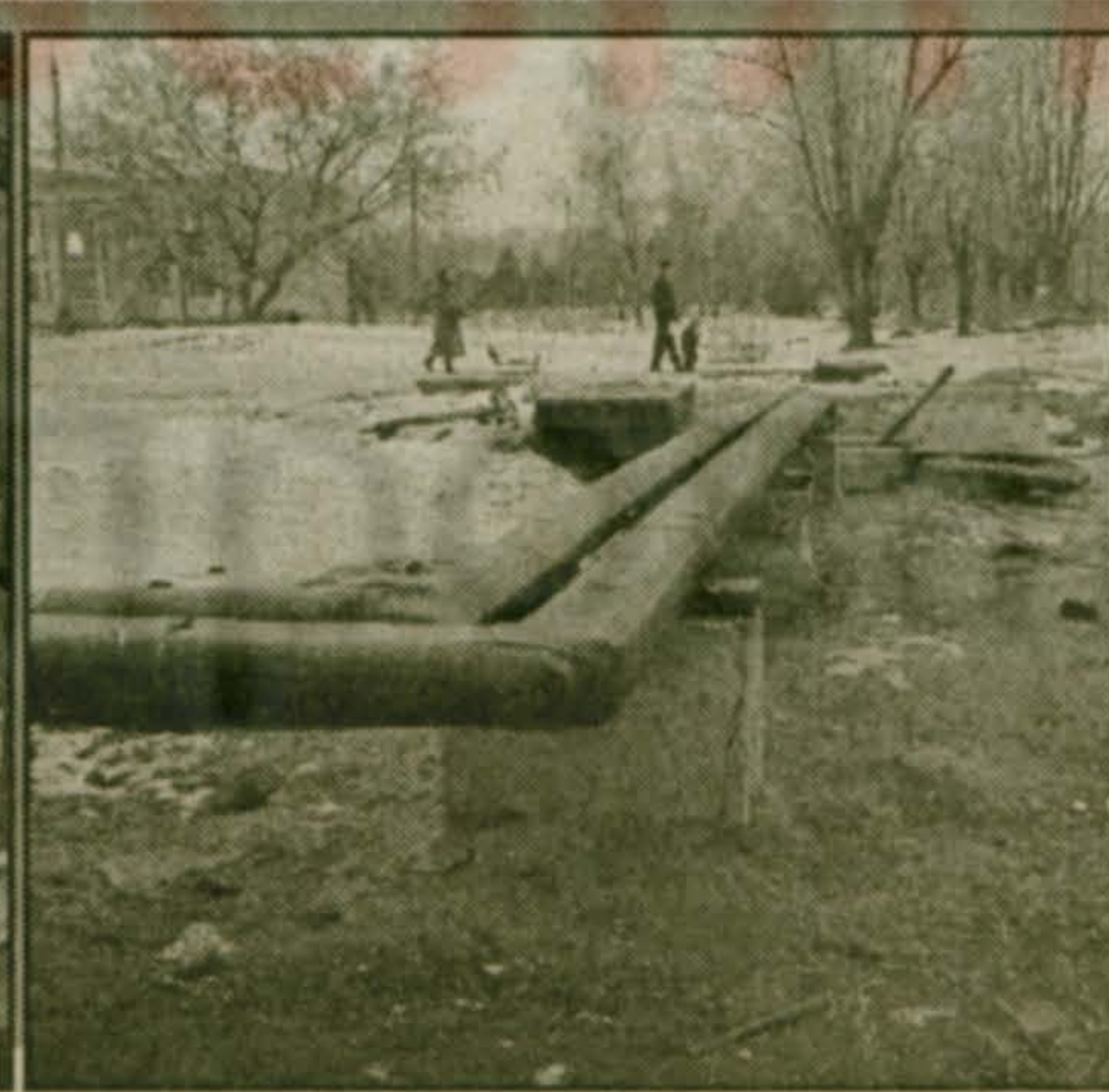
Бесконечный капитальный ремонт теплотрасс в поселке Птицефабрики