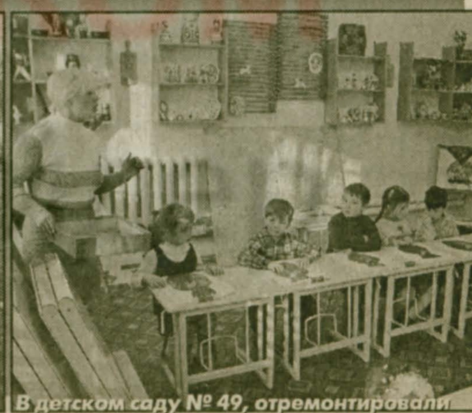
В детском саду № 49, отремонтировали помещения для логопедической группы, спортивный зал, зал для занятия музыкой.