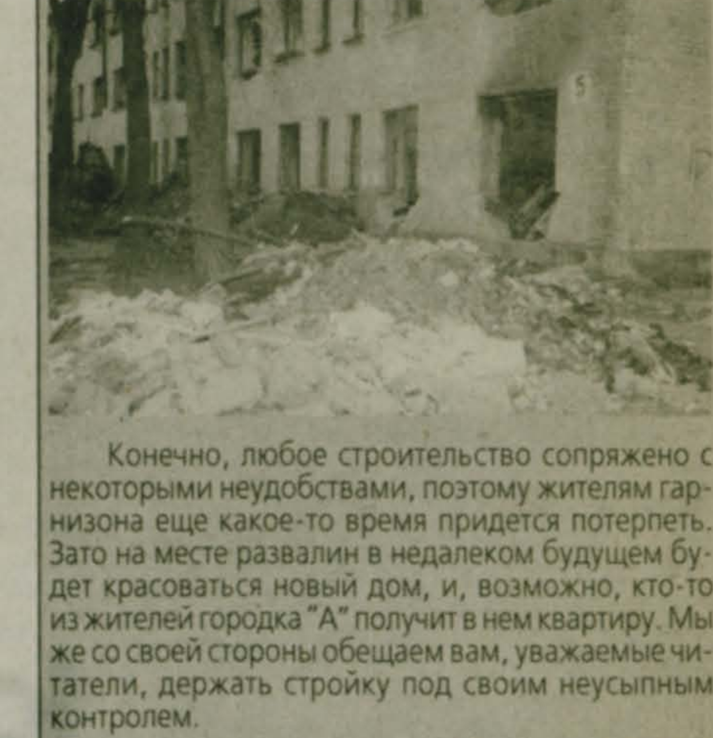
Николай АСЕЕВ

Его автор прописан, как обычно мы прописали в Люберецкий военный городок "А" и "Б", где ты строишься у дома № 5. На следствии думи с фотокорреспондентом отпавшим по указанному адресу. Действительно, здесь находился дом № 5, но люди из него давно выслены, и он практически разломан.